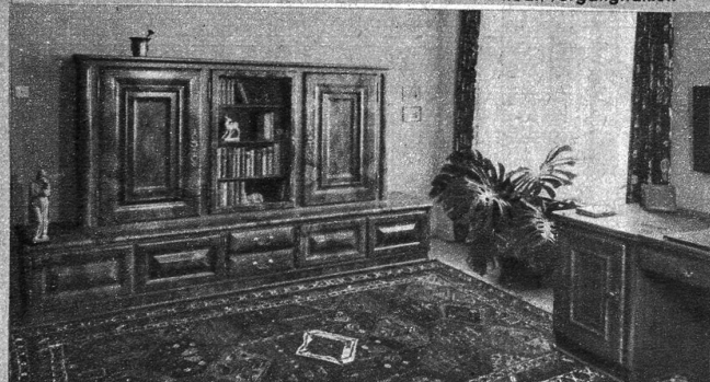
Klassisch schöne Bibliothek, wie sie nur ganz selten heute noch zu finden ist. Die nachvollenen, rässigen Profile kontrastieren großartig mit der ruhigen Patina des herrlichen Pyramid-Nußbaumholzes