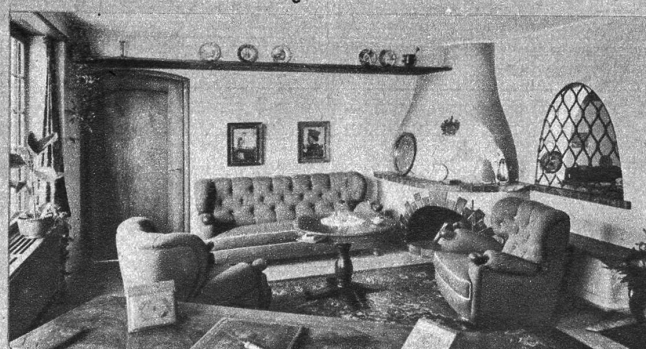
Eine wunderschöne Kaminecke mit dem Familienwappen. Ein Beispiel unter 100 Beispielen aus der Fabrikausstellung in Suhr. Hier findet der Besucher 1000 wertvolle, originelle Wohnideen. Sie schenkt dadurch jedem Besucher reichen Gewinn!

Der Pfingstmontag ist in Bern und Suhr denjenigen Verlobten reserviert, die unter der Woche nicht abkömmlich sind. Bei Kauf erhalten Sie volle Reisevergütung.