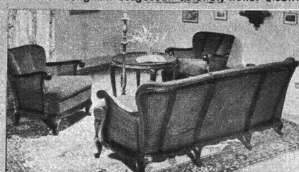
Luxuriöses Ameublement im Régence-Stil mit Double-Cannage.