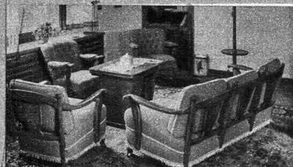
Behagliche Polstergarnitur. Sie ist zeitlos schön im Stil.