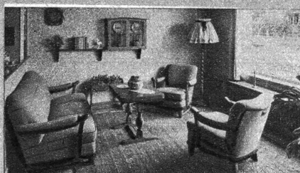
Malliges Klübmöbel-Arrangement. Kennt weder Mode noch Vergänglichkeit