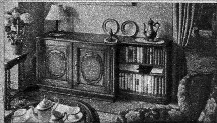
Vornehm und doch heimelig wirkende Wohnecke mit maximaler Raumnutzung

keitswert und die Ambiance einer Wohnung. Vorbildlich ist die stimmungsvolle Intimität und Behaglichkeit, die jedem einzelnen dieser aparten Interieurs eigen ist. Diese herrliche Fabrikausstellung ist für alle wohnbegeisterten Menschen die größte Sehenswürdigkeit auf dem Gebiet schweizerischer Heimgestaltung. Sie liegt mitten im Herzen unseres Landes, — direkt an der großen Ueberlandstraße Bern-Zürich — in Suhr bei Aarau und ist von überall her in kürzester Frist per Velo, Moto, Auto oder per Bahn leicht und rasch zu erreichen. Vom Bahnhof Aarau besorgt ein permanenter Gratis-Auto-dienst die Führung direkt in die Fabrik und retour. Ihre Pfingsfahrt am Montag ins schöne Suhrental, wird für Sie der Höhepunkt dieser Festtage und ein beglückendes, unvergeßliches Erlebnis sein!