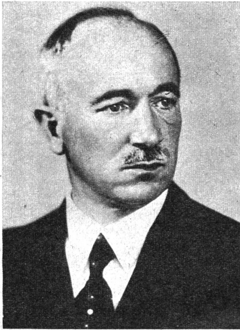
Präsident Benesch demissioniert. Präsident Benesch, der sich nicht entschliessen konnte, die neue kommunistische Verfassung zu unterschreiben, hat, wie aus Prag gemeldet wird, in einem Schreiben der tschechoslowakischen Regierung seine Demission bekanntgegeben. U. B. z. die neueste Porträtaufnahme Beneschs.

Das sind alles Aeusserungen, welche dem Ständerat den Rücken steifen werden; man wird heute feststellen müssen, dass am Widerstand unserer «Zweiten Kammer», der sich noch versteifen dürfte, die Absichten des Bundesrates hart anprallen werden, und dass sich die Suche nach andern Auswegen schon jetzt aufdrängt. Die Handelskammer verlangt einen Tilgungsplan, in welchem zwar kein Krisenfond, wohl aber Rücklagen für Krisenjahre vorgesehen wären. Damit würde die Starrheit dieses Tilgungsplanes gebrochen. Er verlangt eine mit 100 Millionen zu veranschlagende eidgenössische Verrechnungssteuer, mit Rückvergütungen an die Kantone. Er ist für eine allgemeine Getränkesteuer und hält sie «für die Bundesfinanzreform unentbehrlich». Er ist der Ansicht, die Geldentwertung habe das Gewicht der Steuerlast nach der Seite der direkten Steuern hin ver-