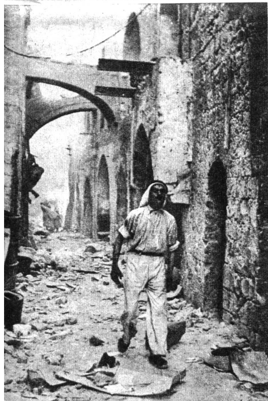
Ein erstes Bild von der Altstadt Jerusalem, nachdem sie von den Arabern eingenommen wurde. Unser Bild zeigt einen Araber in einer schmalen Gasse, die ganz von Trümmern übersät ist.

Die neuen, von republikanischer Seite ausgehenden Angriffe gehören selbstverständlich in die Reihe der zu erwartenden Wahlmanöver. Andere werden folgen, und man kann sich vorstellen, unter welchen unerwarteten Quertreibereien der Aufbau Europas zu leiden haben wird. Es sind übrigens schon andere, sehr merkwürdige Nebengeräusche bekannt geworden, vermutlich auch aus der Truman feindlichen Wahlkampf-Küche. Oder aber von Trumans Regierung selber, in der Absicht, jeglichen Vorwurf, sie vergeude Amerikas Finanzen an Unwürdige oder Konkurrenten, von sich abzuwälzen. In England verlautet, Washington behalte sich vor, Ländern, welche Beträge aus der Marshallhilfe erhielten, die Abwertung ihrer Währung vorzuschlagen. Zweitens solle sie verweigert werden, wenn ein Land Amerikas Interessen entgegenhandle. Drittens sollen nachträglich Bedingungen über den Handel der sechzehn Länder mit Japan und Korea aufgestellt werden. Stimmen diese Nachrichten, so darf man sich nicht über die schwarzen Stunden wundern, welche gegenwärtig einige westeuropäische Regierungen durchmachen.