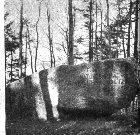
Der Findling am Hondrich ist mitten im Wald gelegen

Nicht weniger als vier Findlinge aus der Gletscherzeit sind im Gemeindebann von Spiez erhalten geblieben. Nördlich der Bürg liegt ein Granit, der vielleicht von der Höhe herabgestürzt ist und bisher wenig Beachtung fand. Am bekanntesten ist der Katzenstein in den Reben am Spiezberg, in ca. 600 Meter Höhe gelegen. Der grösste Gespene, der Fuchsenstein, findet sich in der Nähe der Eisenbahnbrücke über die Kander. Er hat eine Länge von fast 10 Metern und ragt 8 Meter aus dem Aluviaboden. Wie weit er in die Tiefe reicht, ist bisher noch nicht untersucht worden. den höchsten Standort hat der erratische Block auf dem Hondrichhügel, der in einer Höhe von 850 Metern frei auf den Felsen aufliegt. Glücklicherweise sind alle vier Spiezesteine geschützt.