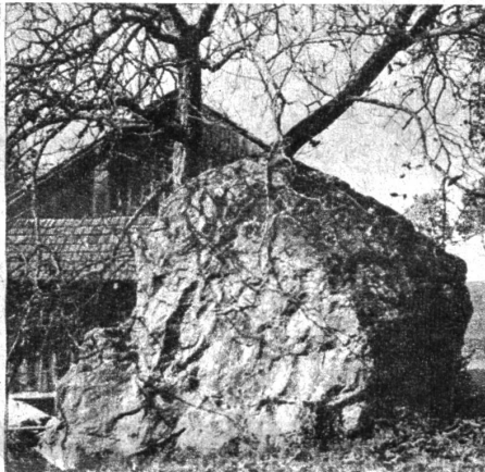
Links: 8 m hoch ragt der Fuchsenstein in der Nähe der Eisenbahnbrücke über die Kander aus der Erde hervor. Rechts: Nördlich der Bürg bei Spiez liegt dieser Findling

auf den Tisch legen. Er schreibt nicht, um zu schreiben; er schreibt, wenn ihn die Stunde zum Schreiben zwingt. Und was er schreibt, ist gedichtet: dies spürt man jeder Zeile an. Schon damals spürte man es, als er einst seine «Seelchen» in die Welt flattern liess — jenes herrliche Bändchen Verse, das J. V. Widmanns Gefallen weckte. Nun legt er uns seine Verse in Bieler Mundart vor, eine auserlesene Ernte aus vielen Jahren, wahrscheinlich aus Jahrzehnten. Es ist weniger die Besonderheit der ortsgewundenen Mundart, die aufmerken lässt, sondern vielmehr — wie einst bei den «Seelchen» — der vernonnene Ton, das Feine, Zarte, die Musik und die besinnliche Gedankenwelt.