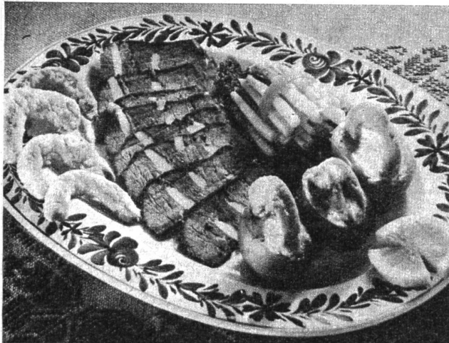
Gespickter Braten, garniert nach Tiroler Art

Sie kennen Tante Hanna? Nicht? — nun Tante Hanna kommt zum erstenmal in den jungen Haushalt, und da möchten Sie doch ein Essen aufstellen, das auf gar keinen Fall irgendwie nicht gelingen kann. Doch — es sollte was Besonderes sein. Hier ein Vorschlag: