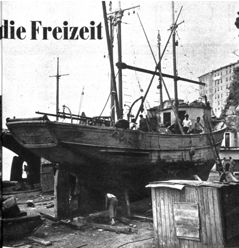
Im Hafen liegen alle Schiffe auf den einfachen Docks (Reportage OMNIA, Bern)

Je schwerer seine Arbeit ist, je tiefer gibt er sich auch den Freuden der Freizeit hin und seine Phantasie sorgt dafür, dass keine dieser kostbaren Stunden verloren oder einfach Langeweile ist. Am Strande fallen die Muscheln und Kleintiere der heissenden Lötlampe oder der scharfen Spachtel zum Opfer, im Dorfe aber wird vierzehn Tage lang nur das allernützlichste gearbeitet. Es ist eine Zeit der Tänze und der Spiele, der endlosen und aufregenden Reden und eine Zeit, in der viel versäumter Schlaf nachgeholt wird. Wohl senkt hier und da ein Fischer bei dem Gedanken, dass ihm nun viele Lire entgehen