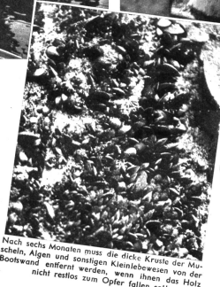
Nach sechs Monaten muss die dicke Kruste der Muscheln, Algen und sonstigen Kleinlebewesen von der Bootswand entfernt werden, wenn ihnen das Holz nicht restlos zum Opfer fallen soll

Dann können die Fischer nach einer langen Periode schwerer Arbeit auch zwei Wochen lang Ferien machen und in Festtagswänder durch ihr Dorf spazieren