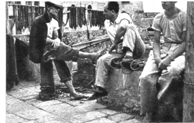
Endlich hat man einmal Zeit zu den Plaudereien, die wohl niemand so liebt, wie der Italiener

und dass die Zeit der Feste dem Ersparnen auch nicht gerade sehr zuträglich ist, aber in Italien lebt man mehr als anderswo auch um des Vergnügens willen, und so sind denn diese Seutzer im Grunde nicht mehr als Koketterie. Und wenn dann die ersparten und saner verdienten Lire nahezu aufgebraucht sind, bringen die Arbeiter am Strande auch meist schon die Kunde, dass die Schiffe nun wieder sauber und in der Ordnung sind. Dann fahren sie Iriech gestärkt und gut erholt wieder Tag und Nacht hinaus und gönnen sich kaum einige Stunden der Ruhe. Denn das Leben ist sehr teuer in Italien, und es