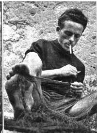
Selbstverständlich benutzen die Fischer die von der Natur gebotene Freizeit auch, um die notwendigen Reparaturarbeiten an den Netzen durchzuführen