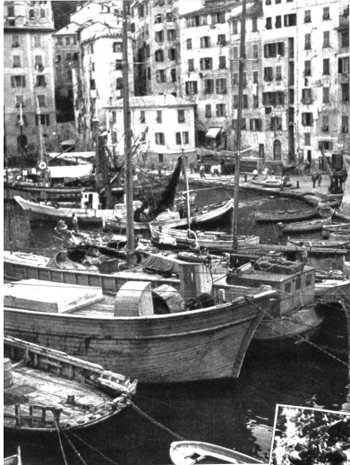
Unzählige kleine Dörfer am Rande des Mittelmeeres leben ausschließlich vom Fischfang

beitsperiode zu einem Urlaub kommen. Gierig stürzen sich die Muscheln, Algen und kleinen Seetiere auf das Holz der Boote, saugen sich an ihm fest, verkreben sich dort, bilden dicke Ablagerungen und fressen sich im Laufe ihrer verschiedenen Daseinsprozesse immer tiefer in das Holz hinein. Ein oberflächlicher Kampf würde nur wenig nützen, und so lassen die Fischer die dicke Kruste der Lebewelt an ihren Booten und nehmen alle sechs Monate eine Generalreinigung vor. Länger als sechs Monate dürften sie nicht warten, weil sonst das Schiff verloren wäre. Und während am Strande die Schiffe auf die Docks gezogen sind und von fleissigen Männern gründlich bearbeitet, gereinigt, neu gestrichen und instand gestellt werden, geniessen die Fischer im kleinen Dorf zwei Wochen notgedrungen, aber darum nicht weniger freudlicher Ferien, kommen auch sie zu einem «Döke» tag nützen, das sie sich sonst kaum gönnen würden.