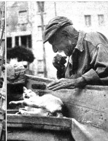
Dann sind die Männer wieder draussen auf dem Meer und nur die Alten geniessen die ständige Freizeit, die sie sich mit einem Leben voller schwerer Arbeit verdient haben