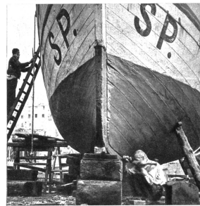
Nach zwei Wochen können die Arbeiter am Strande melden, dass die Schiffe wieder ausfahren können

genügt nicht nur, gerade so viel zu verdienen, um existieren zu können. Man muss sich auch noch eine kleine Reserve schaffen, von der man nach sechs Monaten die Arbeiter zahlen und die Urlaubszeit finanzieren kann, weil schon nach der ersten Ausfahrt mit dem Iriechgestrichenen Boot wieder die ersten Kleinlebewesen am Holz kleben und die Grundlage zu jener gewaltigen Kolonie bilden, die bald schon Millionen von Mitgliedern zählen wird, und deren einzige Existenzberechtigung darin zu liegen scheint, dass sie die Freizeit der arbeitsamen Fischer am Mittelmeer regelt. Pws.