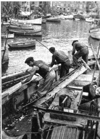
Auch die Deckaufbauten werden bei dieser Gelegenheit gerade einer umfassenden Revision unterzogen