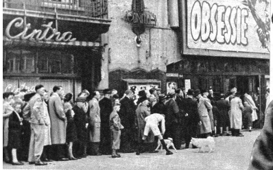
Oben: Schlängenstehen für Luxus: Wer in Holland ins Kino will, muss schon am Morgen Schlange stehen. Der Kinobüch ist nicht rationiert und gehört zum billigsten Vergnügen der heute so genügsamen Hollän-der. Aber auch dieses kleine Vergnügen muss durch Anleihen in der Schlange verdient werden.