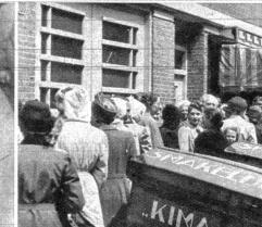
Rationierung: Die Rationen sind in Holland knapp, sind aber gesichert und gerade ausreichend. Es braucht viel Phantasie, um mit den Rationen kochen zu können. Das Einkufen für die holländische Haus-frau ist nicht so einfach wie es für ihre belgische Komeradin ist, und von Zeit zu Zeit gehen die holländischen Bäcker in den Streik