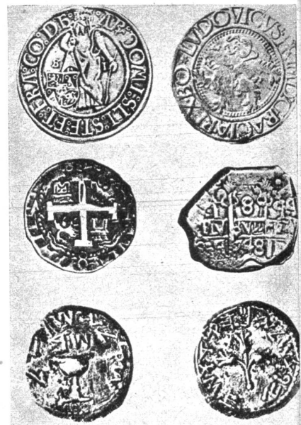
Sehr alte Silbermünzen. Oben der Joachimstaler, Mitte mexikanische Münze, unten hebräisches Silberstück