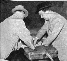
Wer nach Belgien einreist, hat seinen Koffer kaum auf-zuräumen. Wer hingegen nach Holland einreist, hat sich in Schiphol nicht weniger als fünf verschiedenen Kon-trollen zu unterziehen. Das Gepäck wird äußerst ge-nau untersucht und zollpflichtige Waren müssen wirk-lich verzollt werden. Devisen müssen besonders genu-deklariert werden