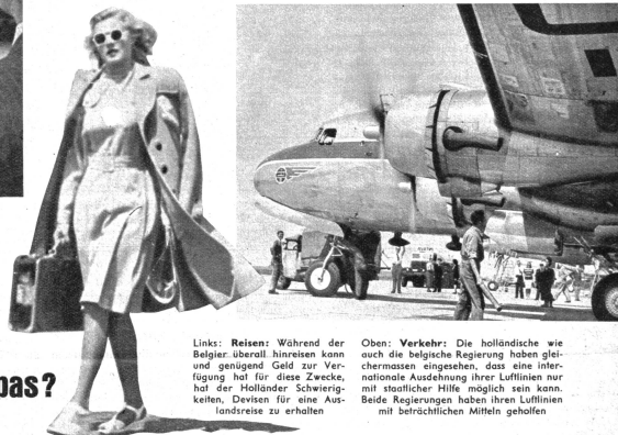
Links: Reisen: Während der Belgier überall hinreisen kann und genügend Geld zur Ver-fügung hat für diese Zwecke, hat der Holländer Schwierig-keiten. Devisen für eine Aus-landsreise zu erhalten.

mungen. Wer nach Holland einreist, hat sein Geld vorzuweisen und wer in Schiphol vom Flugzeug steigt, hat nicht weniger als fünf Kontrollen zu bestehen und über seine Ge-schäfte genaue Auskunft zu geben. Die bel-gischen Zollbeamten hingegen kümmern sich um das Gepäck fast gar nicht, denn wer möchte auch nach Belgien schmuggeln. Es gibt nichts, das in Belgien nicht erhältlich wäre und nicht im Überfluss vorhanden ist. Belgien ist das einzige einst besetzte Land Europas, das dem Vorkriegsniveau heute am nächsten ist und eine Reise von Brüssel nach Amsterdam führt vom Land des Ueber-