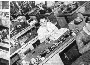
Export und Industrie: Hollands Exportindustrien - Textilien, Radio, Elektrotechnik usw. arbeiten wieder auf vollen Touren, und wenn auch in Eindhoven bei Philips Umrüstungen von Radios hergestellt werden, ist es doch schwierig, in Holland einen Radio zu kau-fen. Devisenbeschaffung geht vor Befriedigung der eigenen Ansprüche