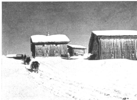
Unterwegs von Safien-Thalkirch nach Safien-Platz

Im Winter ist es im Safiental, einem roten Nebental des Sorderrheinlandes, beglückend still und darum eine Reizenberuhigung abgesehen für überlebe Gläubler. Hier weiß man nichts von Politik, Krieg, Seilziehen, treiben jenseits dem Bärenhorn im Zalgund Ziegen und dem gebirgten Ort an der Grenze und dem bis jetzt eine ununterbrochene Folge von Habselgebirgen dominiert. Und das für Hängel leicht mobilisiert und leicht mit Stübchen abgehoben für hunderte Jahre Schöpfungslagen schreien. Hier weiß best' die Stühreihen bleiben fern, denn nicht einmal ein Postauto fährt im Winter. Nur ein almbühner Schläfen führt die wenigen Gänge von Versam ins Tal hinauf. Im Frühling spuren wir aus dem blauehülligen Tal empur, liegen plötzlich im Sonnenlicht und kühlen, wie berone entläßt. Doch von dem ledigstimmigen Ort wird es ein Zielbild ins Gänge und ein Gerüst nach allen Seiten, das es uns hier von der tieferen führt in einem der Gell-Weite tritt z. S. ins jahrbunterteit Spinnung (das Haus der Zuro-Zuro), nimmt uns bergwarme Gellhöfen in Empfang, die uns das Wörtlein „Gell“ neu erleben läßt.