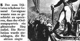
5 Der zum Diktator erhobene General Cavaignac wusste nun so geschickt zu operieren, dass der Ordnungspartei ein glanzvoller Sieg zufiel. Die Revolution wurde zerstreut, die Reaktion siegte.

entzehen solle. Er sah auch, dass Rita fast unmerklich das Haupt schüttelte. "Sie ist ja so zart..." und sah arbeitsderbe Finger über eine mattschwarze Frauenhand gleiten. Der Italiener grüßte mit der böhnischen demütigen Ehrerbietung, die er im Verkehr mit Hgeli und Lausener hatte. Er zog einen Stuhl etwas vom Tische fort, so dass ein wohlgemessener Abstand zwischen ihm und Lausener blieb, und sprach einiges über das Wetter, den Fortschritt der Arbeit - man merkte, dass ihm die Rede gezwungen von Munde lief. Rita trat mit den Speisen ein, und es verlief die Mittagstunde wie sonst. Als sie mit den leeren Schüsseln ging, erhaschte Lausener einen Blick Feltrinellis, der stumm die Bitte eines Kindes an seine Mutter gleichend, welche dieses Kind irgendeiner unangenehmen Aufgabe