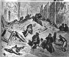
4 Die Franzosen glaubten die Errungenschaften der Revolution als gesichert, aber die Klassengegensätze wirkten sich bis zum Juni in einem furchtlichen Bürgerkrieg aus und Paris sah eine Strassenschlacht wie auch nie, in der auch der Erzbischof von Paris fiel. Die Revolution wurde zerstreut, die Reaktion siegte.

Die Juntschicht in Paris, die eine unüberbrückbare Kluft zwischen der Arbeiterklasse und dem Bürgertum aufgerissen hatte, wurde zum Ausgangspunkt der Reaktion. Als es sich nach der Verkündigung der Versammlung am 12. November um die Volkswahl eines Präsidenten handelte, kamen nur zwei Kandidaten ernstlich in Frage: Der eine war Cavaignac, der andere Prinz Louis Napoleon Bonaparte, der dann seinen Sieg dem magischen Zauber seines Namens verdankte.