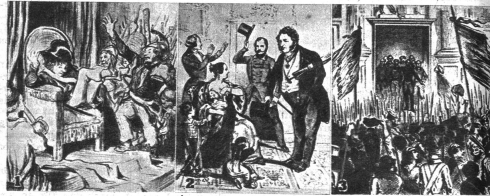
1 Am 23. Februar 1848 stürmte das Volk die Tuileries. Der Thronsess des Bürgerkönigs Louis Philipp wurde herabgeschleudert und inmitten einer Volksmenge auf dem Bastillensplatz am Fuss der Juluskule verbrannt. 2 Der Bürgerkönig Louis Philipp dankte ab, die Barrikadenkämpfer schrien: «Keine Bourbonen mehr, und Ludwig floh nach England, wo er Königin Victoria seine Aufwartung machte. 3 Lamartine proklamierte am 23. Februar 1848 die Französische Republik und die provisorische Regierung verpflichtete sich, die Existenz des Arbeiters durch die Arbeit zu verhängen. Man beschloss die Errichtung von Nationalwerkstätten. Ein Arbeiterparlament wurde einberufen. Aber alles blieb schliesslich ein papierener Beschluss.

Gesinnungsgenossen mit allem Feuer gegen den habburgischen Despotismus. Aber leider reichten die revolutionären Kräfte der neuen Ideen nirgends aus, um einen Sieg davontragen zu können. Die militärisch organisierte Macht war ein starker Bremsklotz. Während Italien mit seinem Unruhen noch Ende 1848 einem brodelnden Kessel gleich, Ungarn mit dem Haus Habsburg im Kampf lag, in Frankreich durch die Präsidentenwahl von Napoleon die Reaktion einsetzte und in Deutschland die Frankfurter Nationalversammlung an die Beratung der Reichsverfassung dachte, ging die Schweiz nach der Beendigung des Sonderbundeskrieges und der Umwandlung von einem Staatenbund in einen Bundesstaat glücklichen und ruhigen Zeiten entgegen.