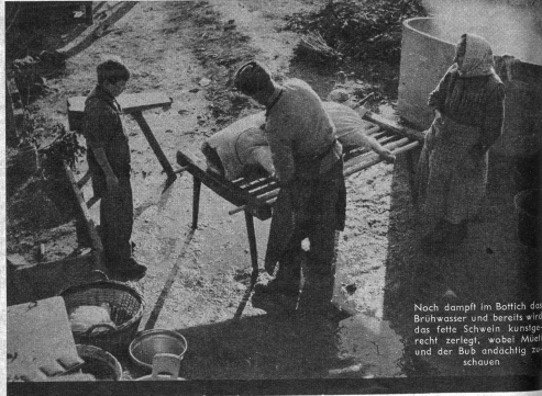
Noch dampft im Bolch der Brühkasser und bereits wird das feine Schmalz kühnig recht zerlegt, wobei Mehl und der Bub eudchtig anschauen