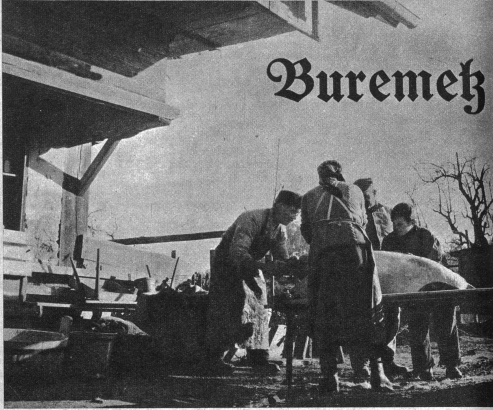
Bei der Metzgerei gibt es alle Hände voll zu tun und Meisterfrau und Meister wie der Bub helfen mit

An alles das denkt er nicht mehr, als er am Sonntagmorgen vor der kleinen Gartenpforte steht. Die Haustüre ist offen. Frühlein von Palombères erscheint auf der Schwelle. Françoise folgt ihr, ein wenig blass unter dem grossen, weissen Hut. Während die Tante Hubert herzlich begrüsst, hat das Mädchen noch ein Klein-