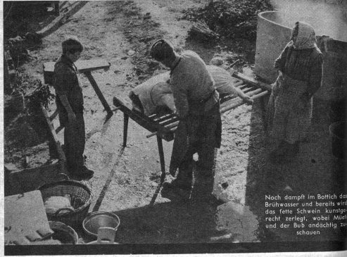
Noch dampft im Bolch der Brühkasser und bereits wird das feine Schmalz kühnig recht zerlegt, wobei Mijel und der Bub eudchtig zusehen