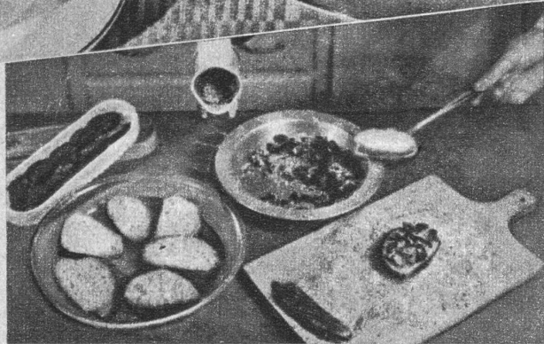
Reiche Ritter bekommen eine Füllung von gekochten Datteln, Rosinen und geriebenen Nüssen