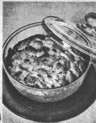
Reisauflauf mit Rosinen