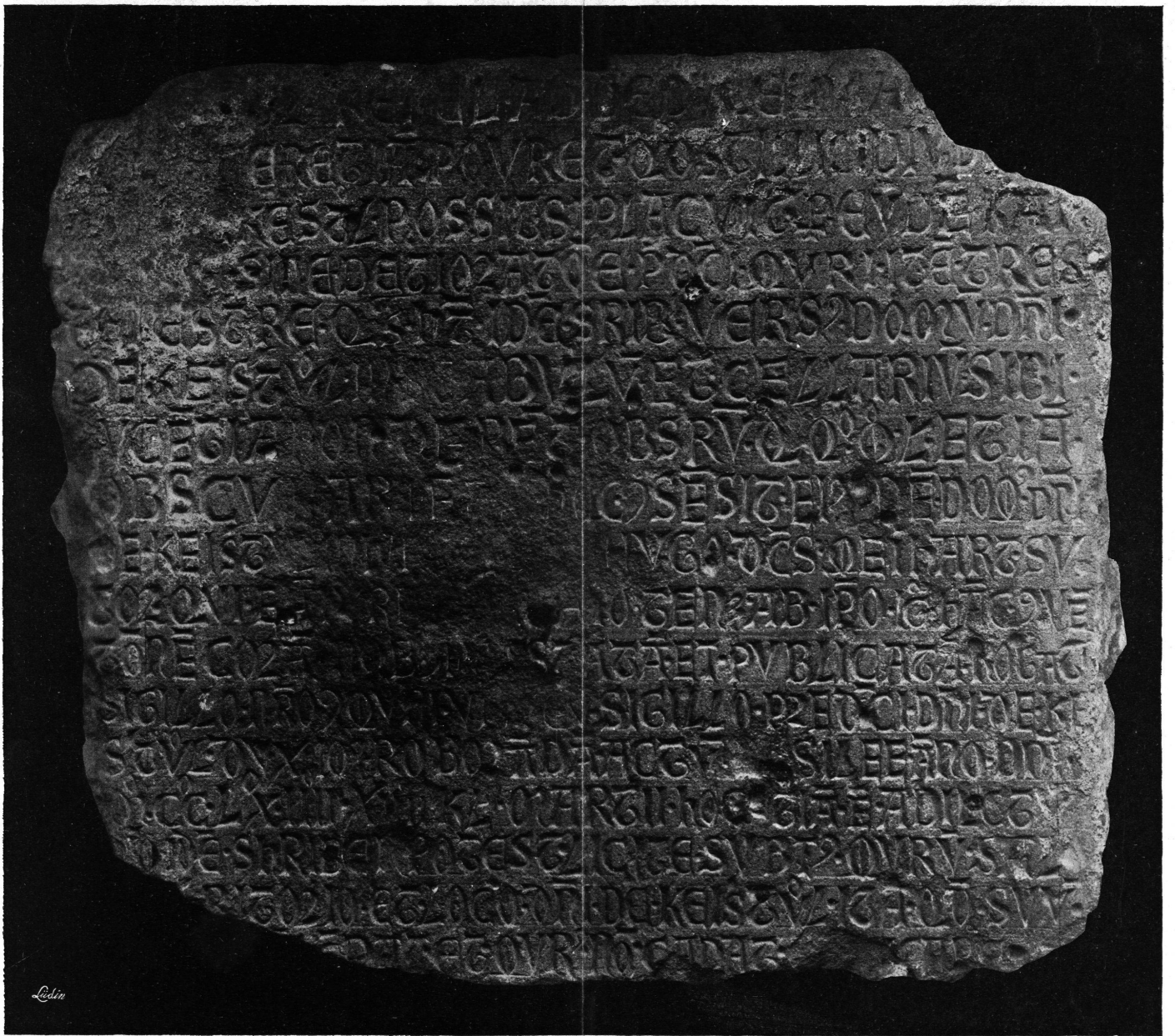
TAFEL V. Basler Steinerkunde von 1264.