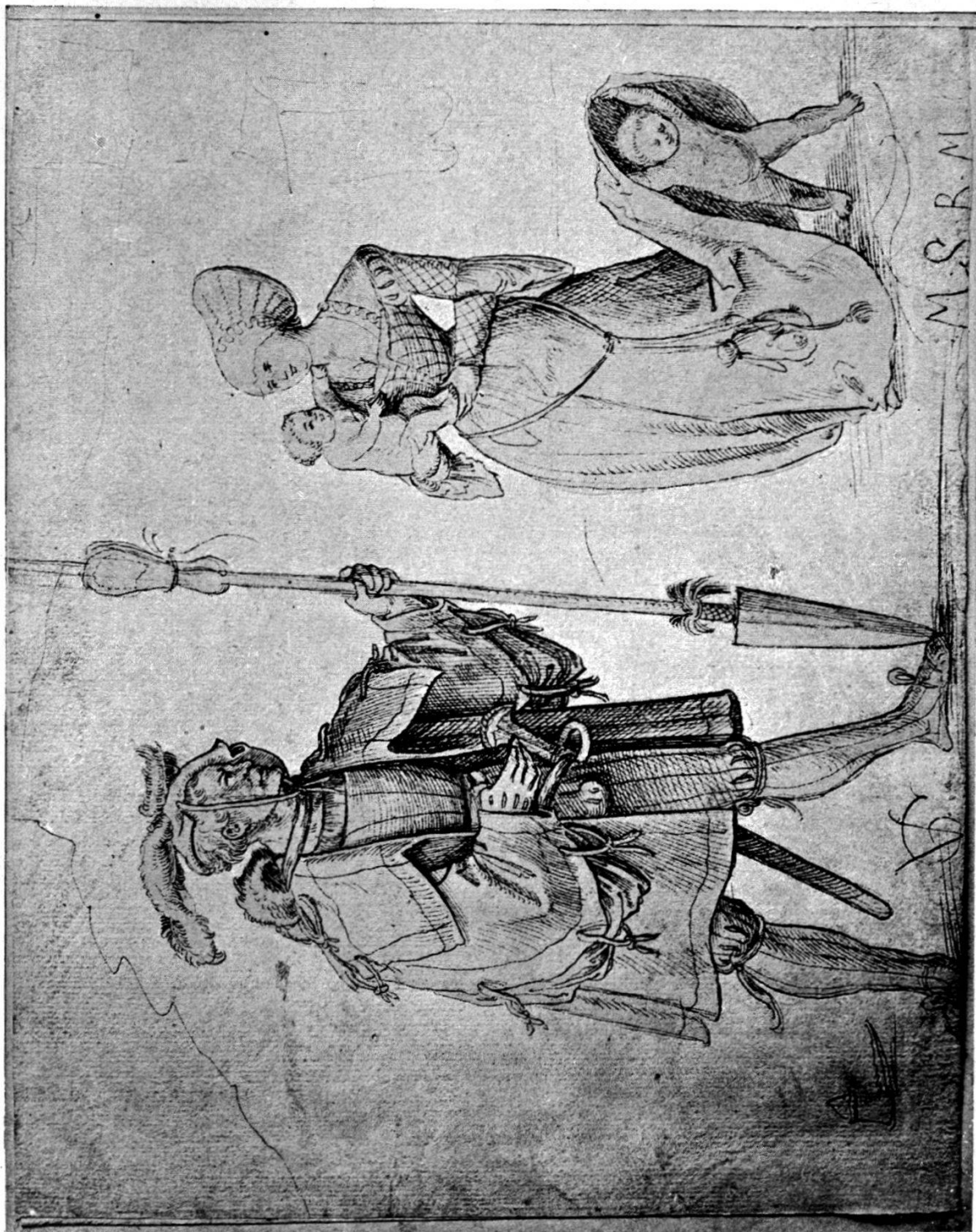
TAFEL III. Urs Graf mit Gattin und Kind, Handzeichnung von Urs Graf 1512.