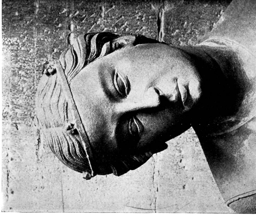
4. Kopf einer törichten Jungfrau am Strassburger Münster.