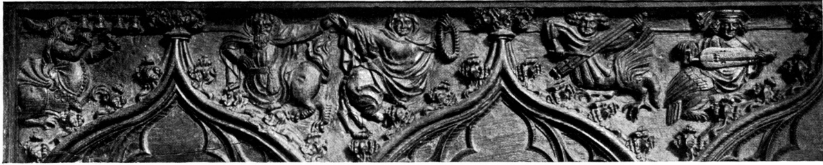
A. Stephanscapelle, links.