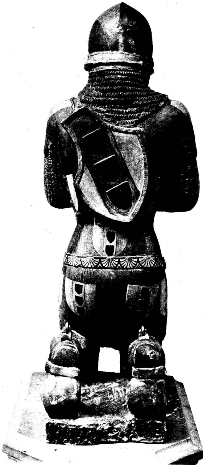
Porträtstatue des Ritters Hüglin v. Schöneegg um 1369 in der St. Theobaldskapelle zu St. Leonhard in Basel.