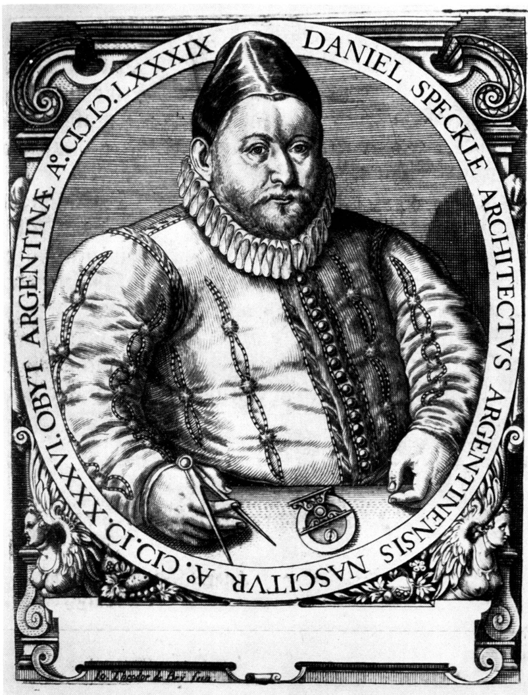
Abb. 1. Daniel Specklin (1536–1589). Nach dem Kupferstich von Johann Theodor de Bry, Frankfurt 1899.