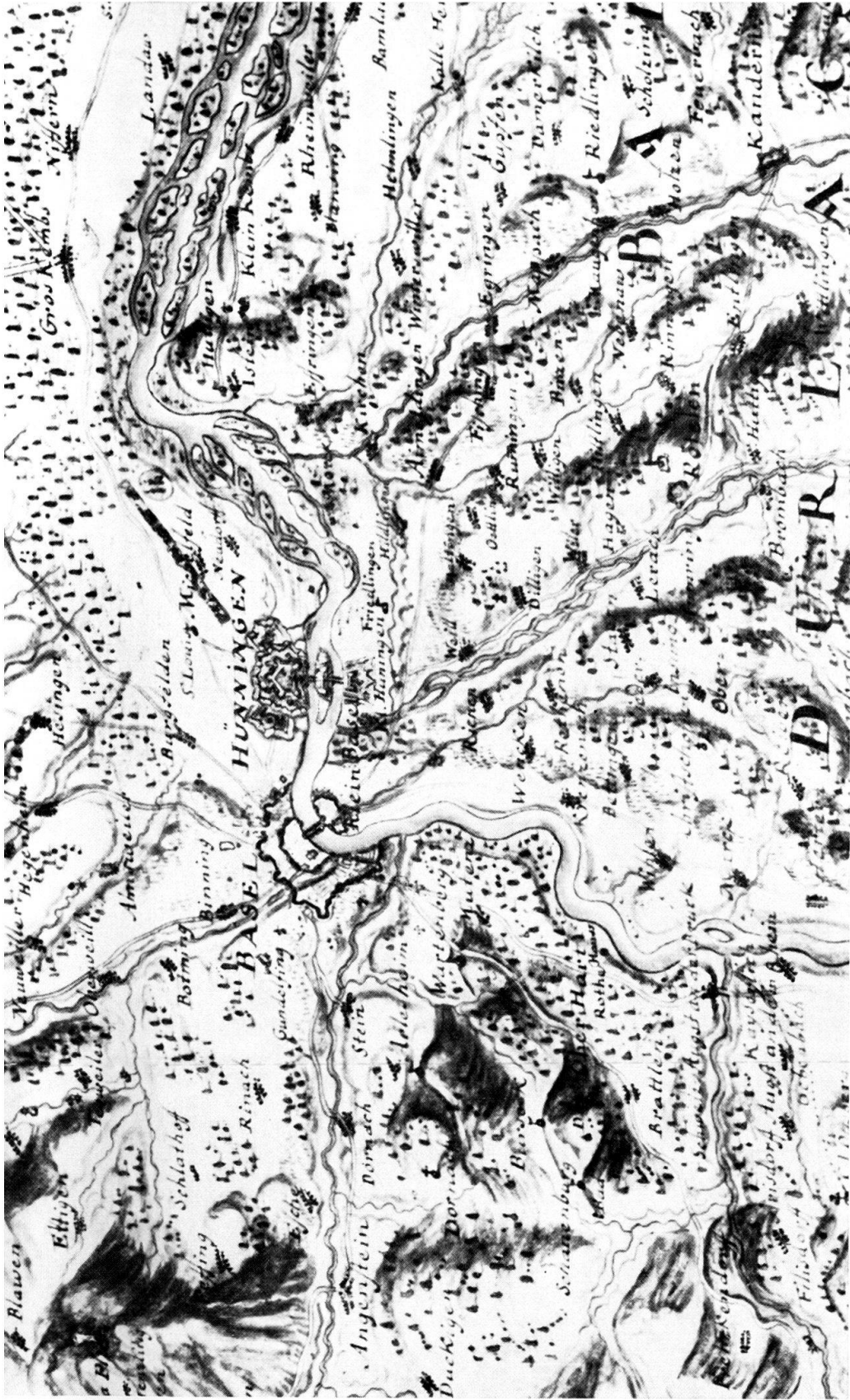
Abb. 3. Ausschnitt (Umgebung von Basel; leicht verkleinert) aus dem Original des Kartenwerks «Theatrum Belli Rhenani 1702-13» von Cyriacus Blödner; im Michelfeld der «Balken» einer französischen Stellung. Kriegsarchiv Wien.