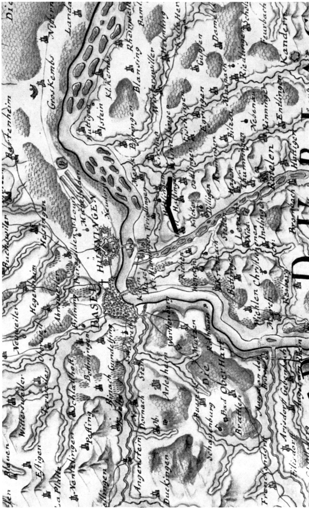
Abb. 4. Ausschnitt aus dem zweiten Exemplar (Kopie) des Theatrum Belli Rhenani von 1713. Bei Michelfelden französische Truppen als zwei Balken eingezeichnet, bei Haltingen Balken aus rotem Papier (kaiserliche Truppenstellung) aufgeklebt.