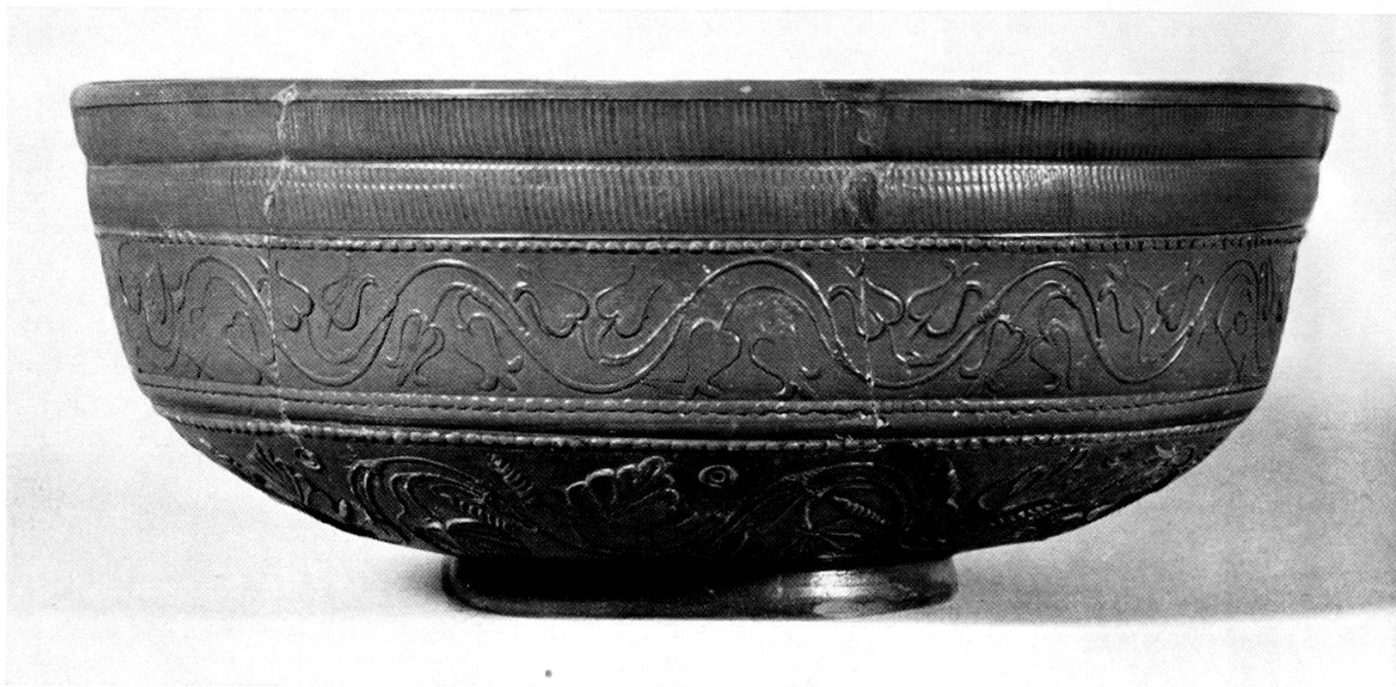
Taf. 2, 1. Schüssel aus Terra Sigillata, Form Dragendorff 29 mit Stempel des Gabianus. Aus Grube 2.