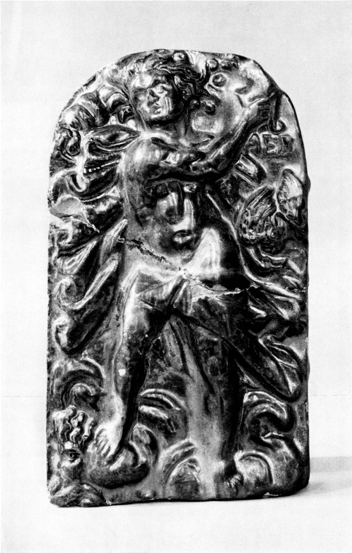
Taf. 1. Ofenkachel aus dem Grabenschutt, allegorische Darstellung der Luft (aer), etwas verkleinert.