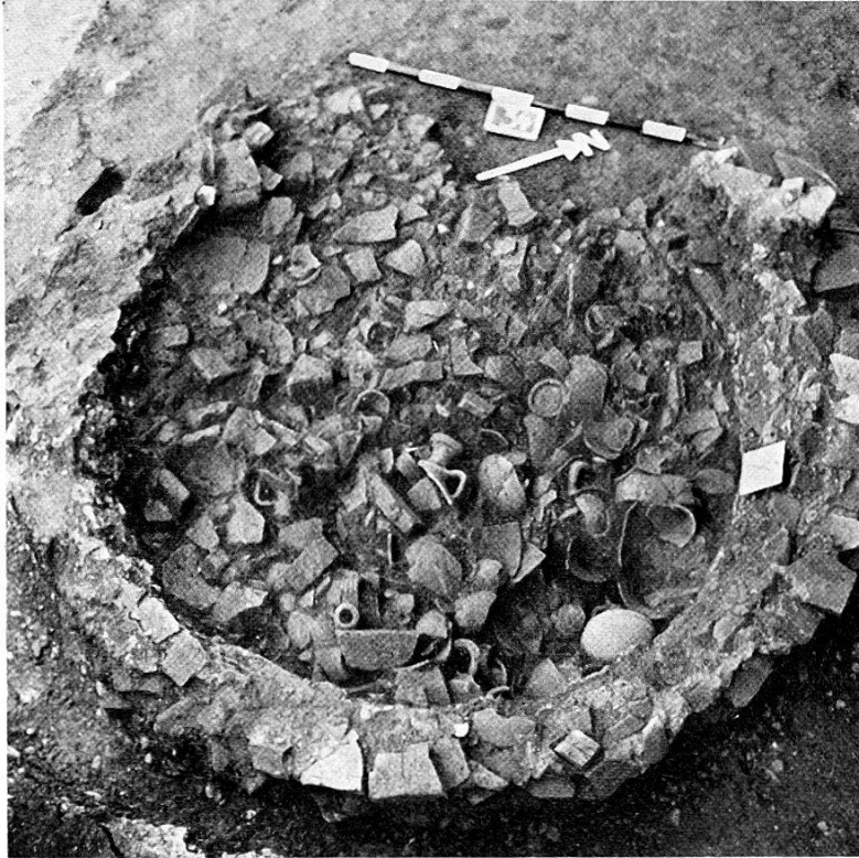
Abb. 2. Augst, Venusstraße-Ost, Töpferbezirk. Ofen X, voll von Töpfereiabfall.