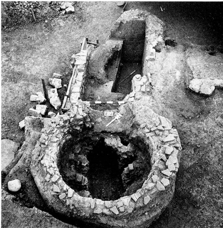
Abb. 3. Ofen X, vollständig ausgegraben.