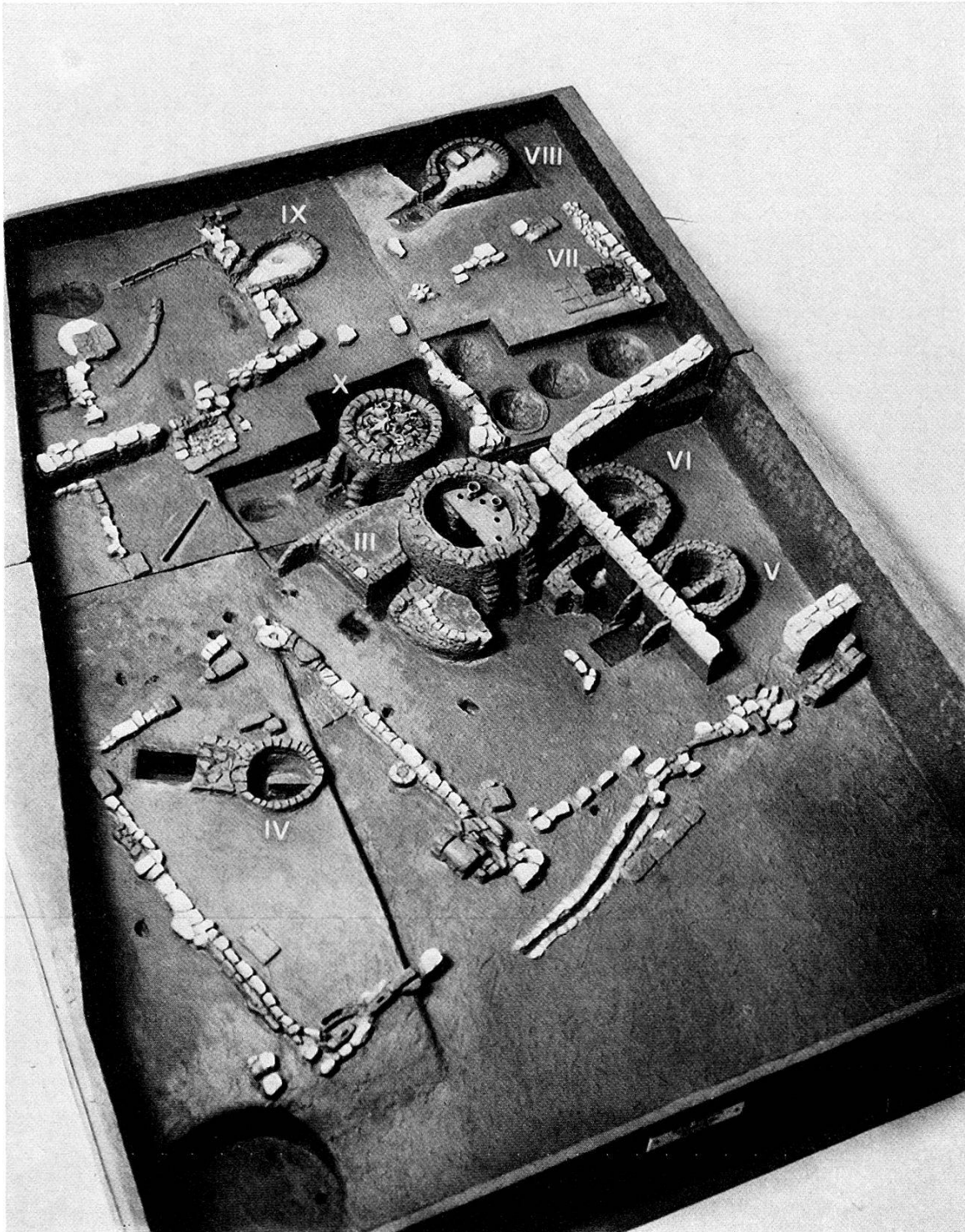
Abb. 1. Augst, Venusstraße-Ost, Töpferbezirk, ausgegraben 1968/69. Modell von Emil Wehrle; Photo Elisabeth Schulz.