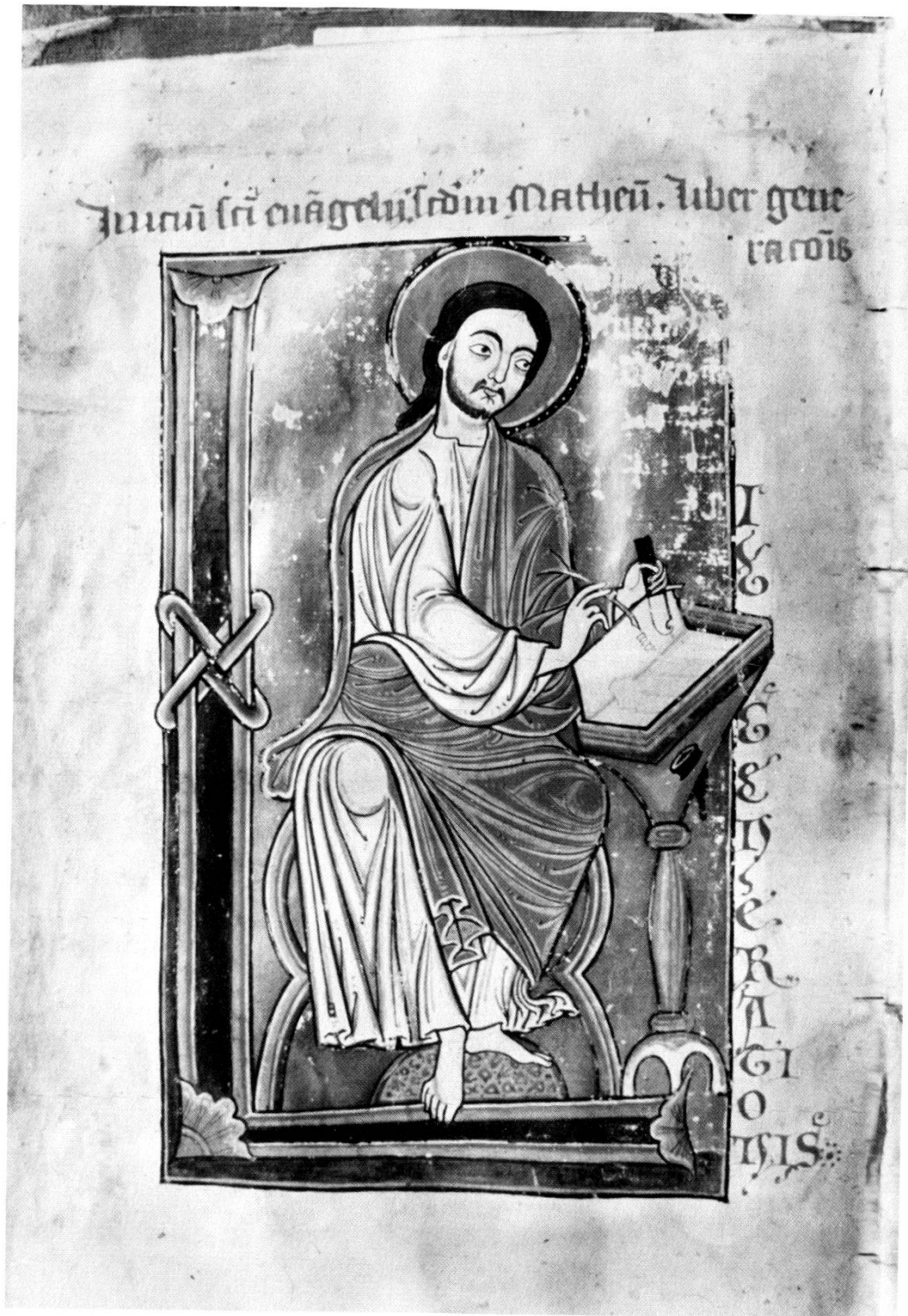
Abb. 2. Der schreibende Evangelist Matthäus im Evangelistar aus Marbach bei Colmar. Ms. 550 der Bibliothèque municipale in Laon. Ende des 12. Jahrhunderts.