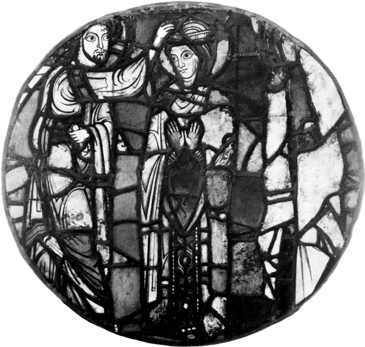
Abb. 3. Die Krönung der Ecclesia. Glasgemälde aus dem Straßburger Münster. (Musée de l'Œuvre Notre-Dame Strasbourg). Um 1196.