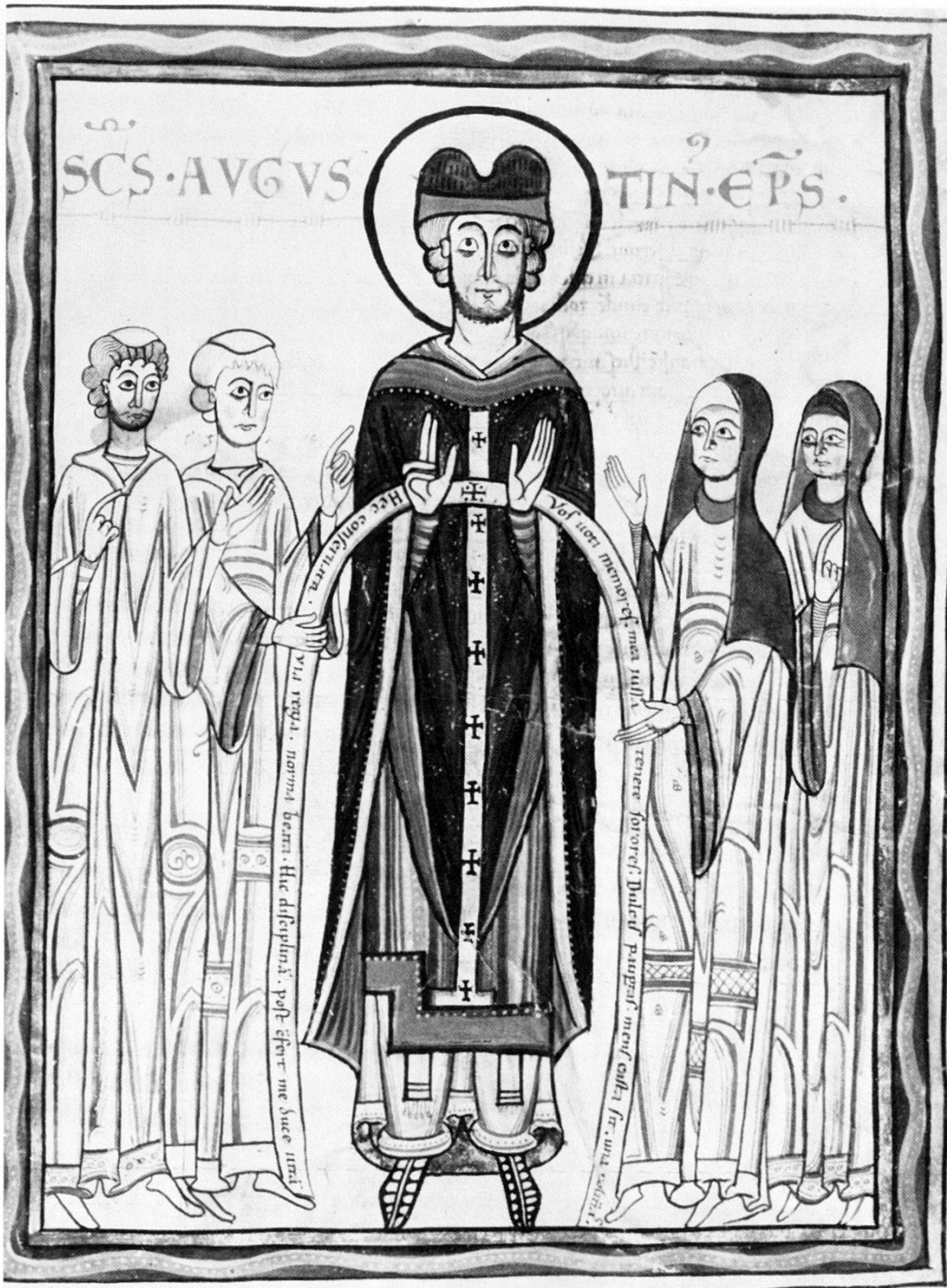
Abb. 4. Der hl. Augustin zwischen zwei Chorherren und zwei Nonnen. Guta-Sintram-Codex aus Marbach-Schwarzenhann, ms. 78 des Grand Séminaire, Straßburg. 1154.