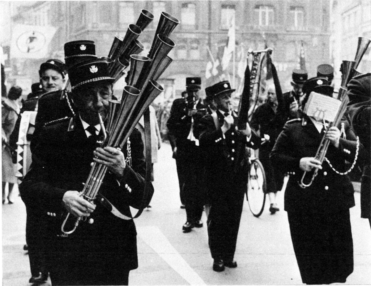
1. Mai 1960