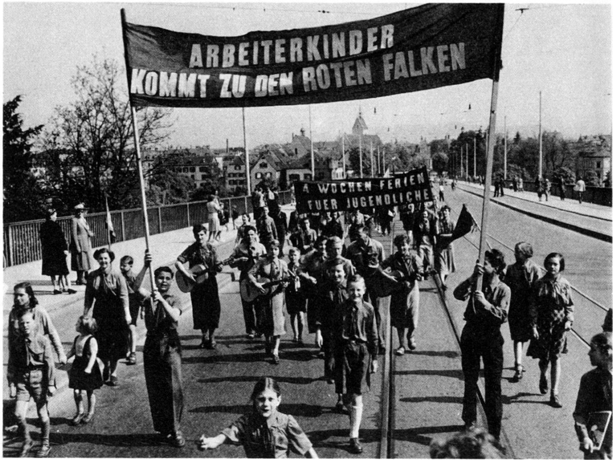
1. Mai 1952