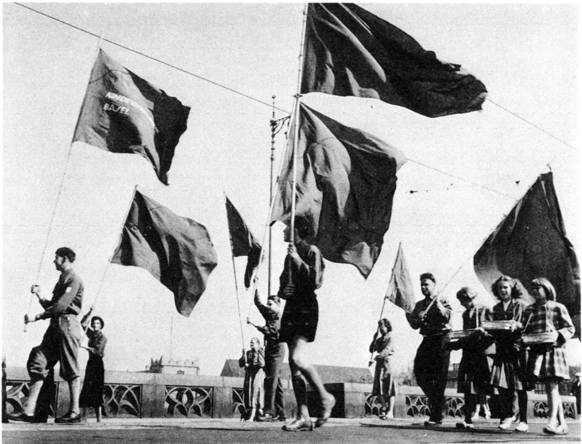
1. Mai 1958