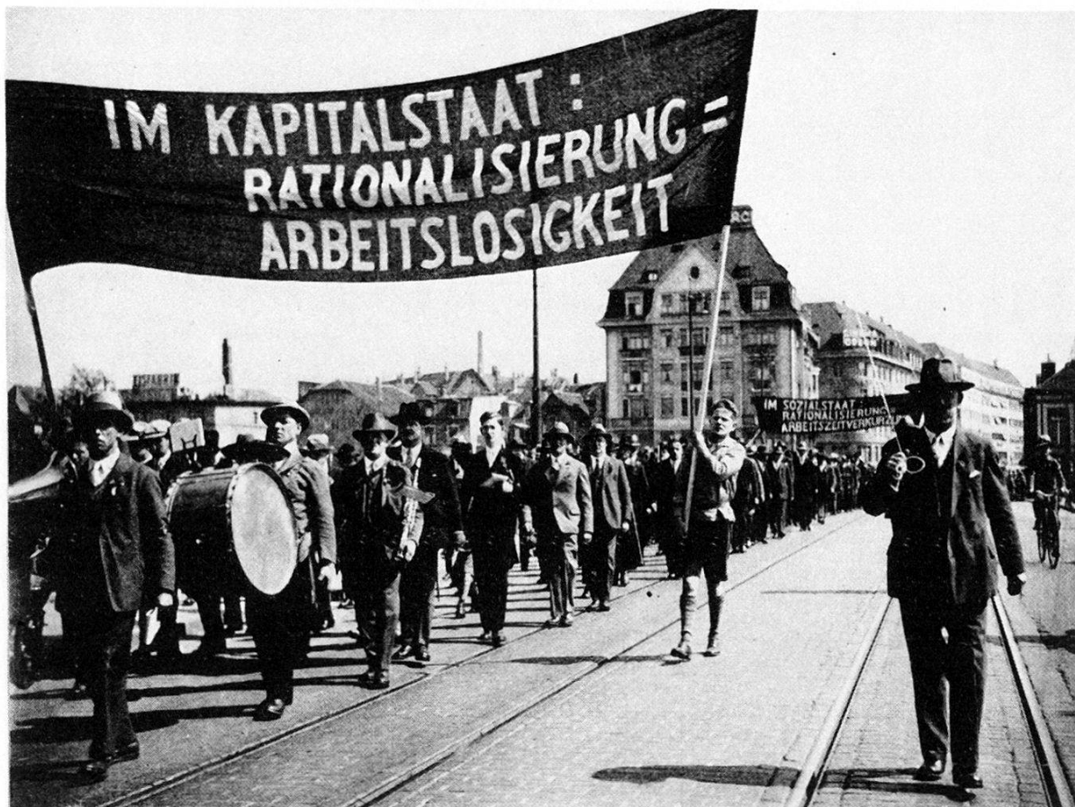
1. Mai 1931