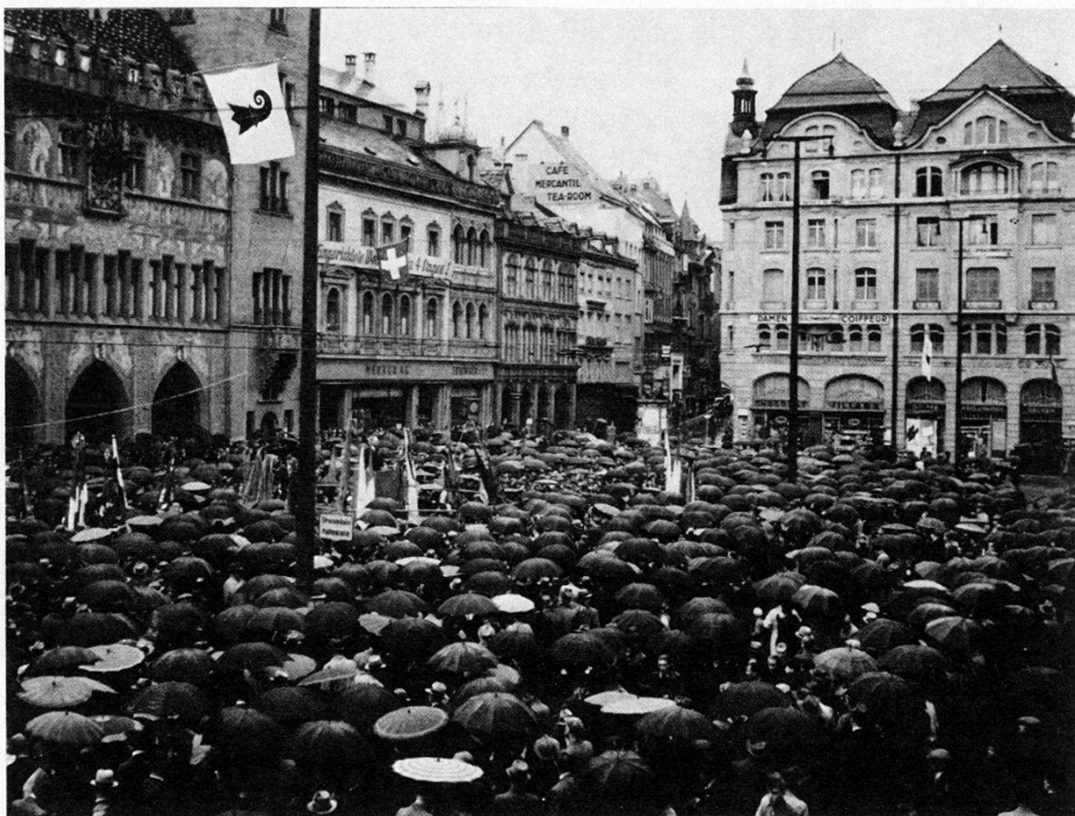
1. Mai 1938