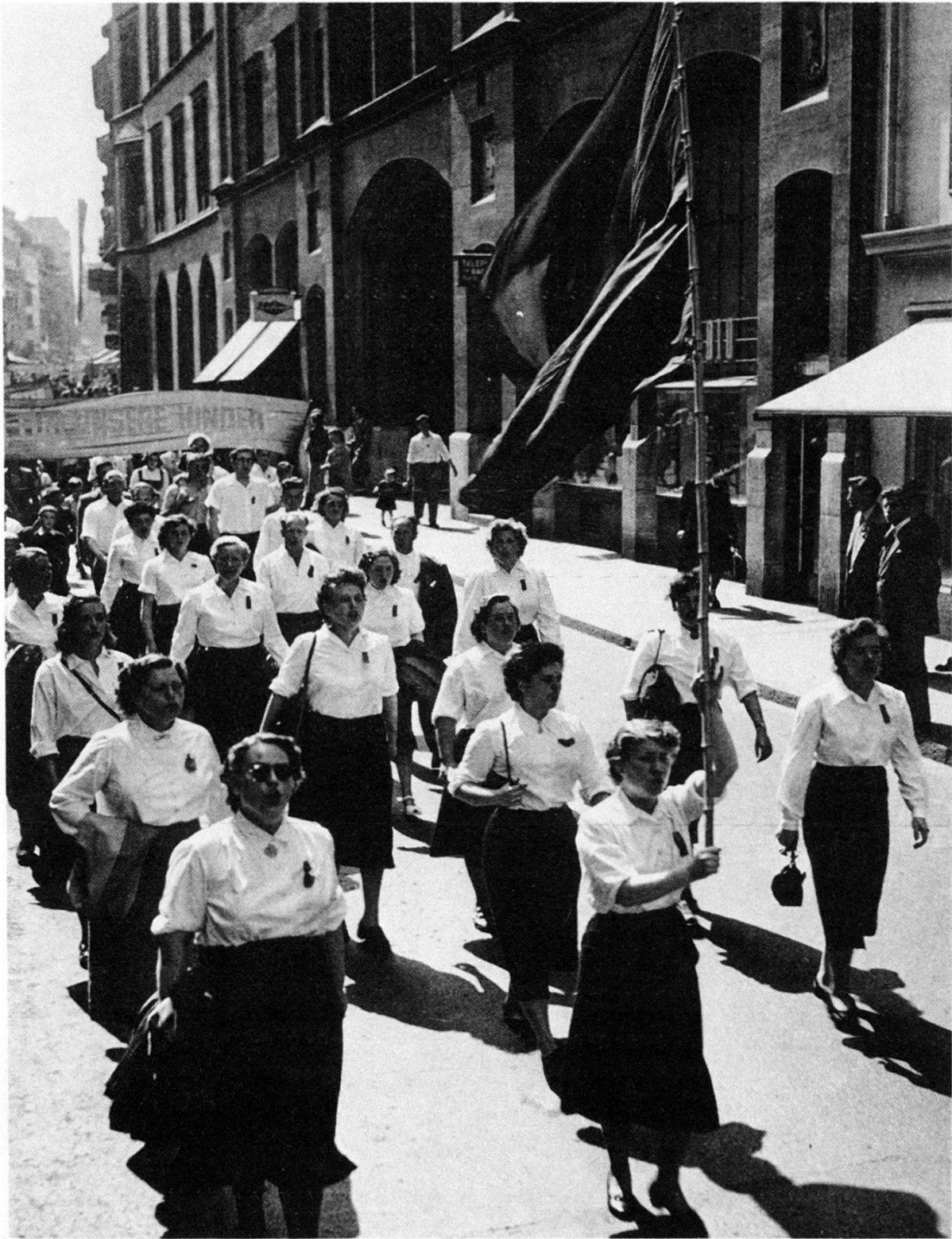
1. Mai 1952