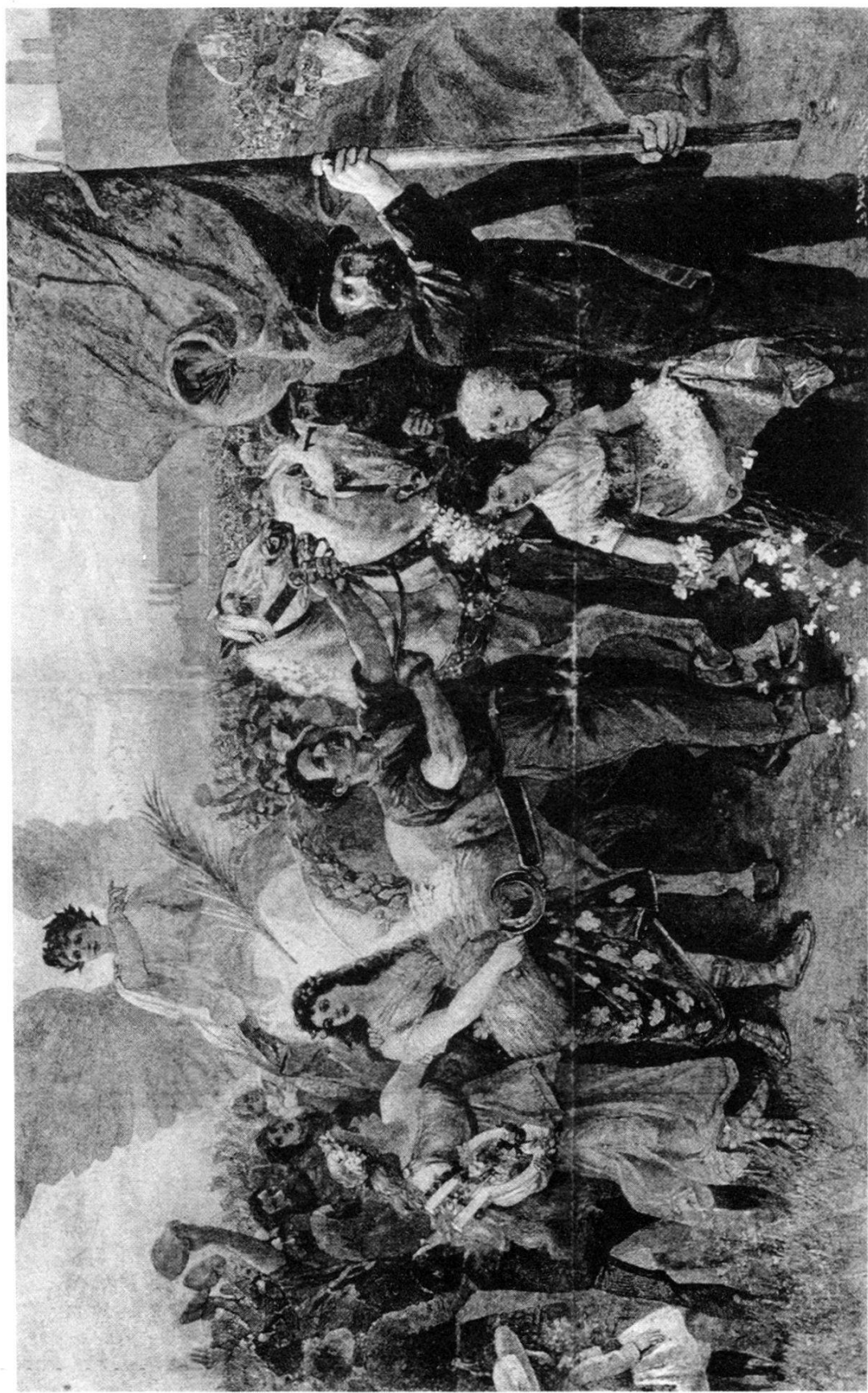
Titelblatt des Basler Vorwärts vom 1. Mai 1901. Der erhoffte Siegesmarsch und Triumph der Arbeiterbewegung wird als grosser Weltenfrühling verstanden: «Wenn laue Lüfte die Natur wachgeküsst haben und wenn es draussen keimt und sprosst, dann atmet auch die bedrängte Menschenbrust wieder auf und eine Flut von neuen Hoffnungen durchströmt das gequälte Menschenherz.»