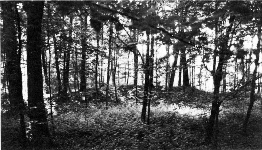
Abb. 2. Muttengz-Hardhäuslischlag heute. Ansicht von Osten.

Südlich der Hügelmitte, unter und zwischen Steinen, kam Grab 1 zum Vorschein (Abb. 3). Die Tote, in Rückenlage mit dem Kopf im Osten, war mit zwei Armringen (1.2), einer Fibel auf der Brust (3) und Fragmenten von weiteren Fibeln (4) sowie zwei Fussringen (5.6) ausgestattet. Ebenfalls zu diesem Grab gehören der gewundene Bronzedraht einer Fibelsehne (7) und ein verrostetes Stück Eisen in Form einer «Pfeilspitze» (8) sowie in Fussnähe zahlreiche Scherben eines Gefässes (9).