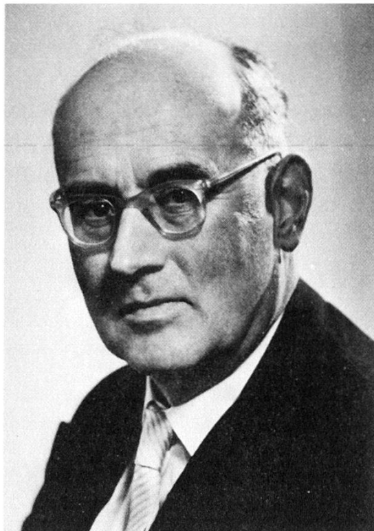
Rudolf Laur-Belart (1898–1972)