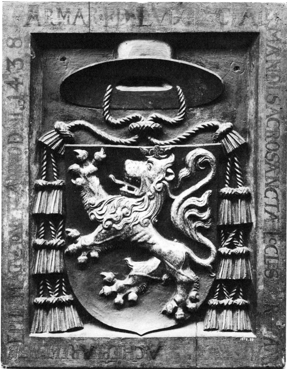
Totenschild des Kardinals Ludwig Alleman, Erzbischof von Arles und Präsident des Basler Konzils, gestorben 1438. Holz, bemalt. Depositum der HAG im Historischen Museum Basel.