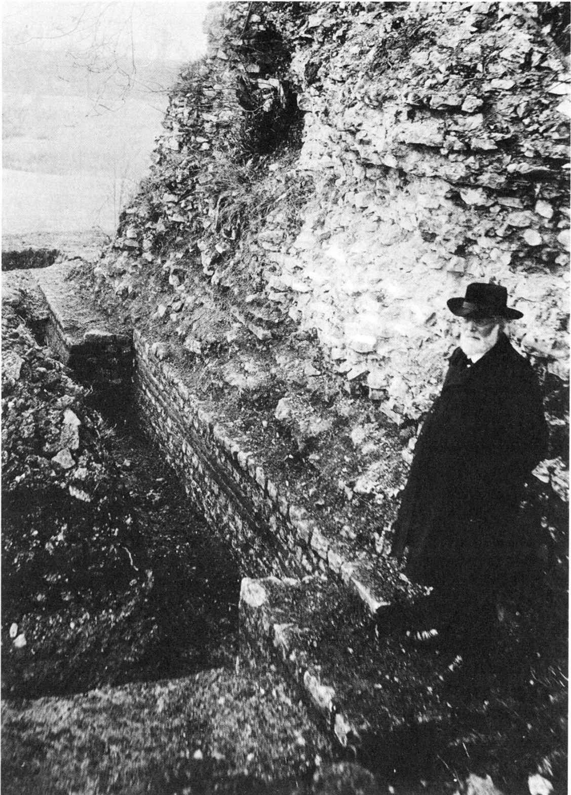
Theophil Burckhardt-Biedermann (1840–1914) in den Ruinen von Augst, 1908