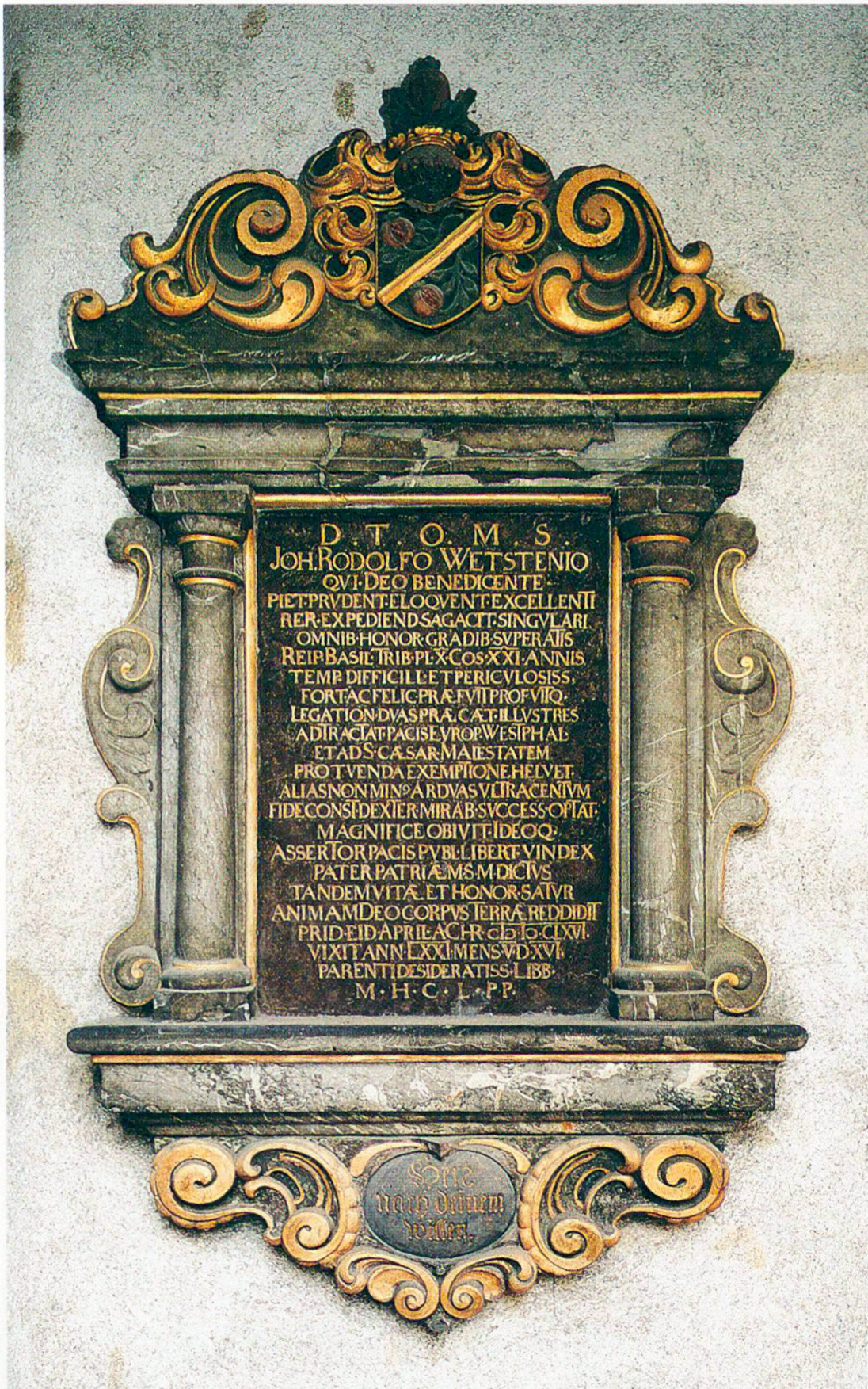
Abb. 2. Epitaph für Bürgermeister Wettstein im Kleinen Kreuzgang des Basler Münsters, Zustand 1998.