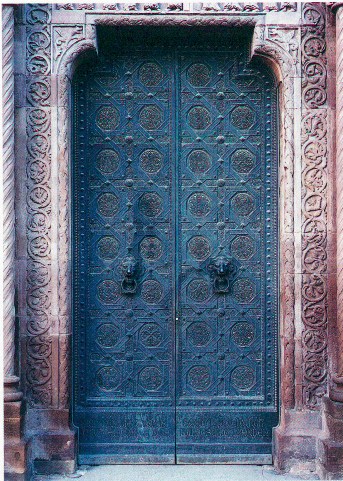
Abb. 2. Basler Münster, Galluspforte: Bronzetüren in der Gesamtansicht.