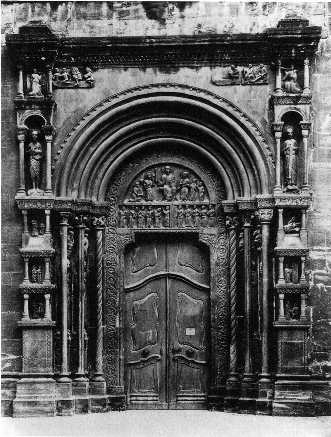
Abb. 1. Basler Münster, Galluspforte: barocke Holztüre (Zustand vor 1892).