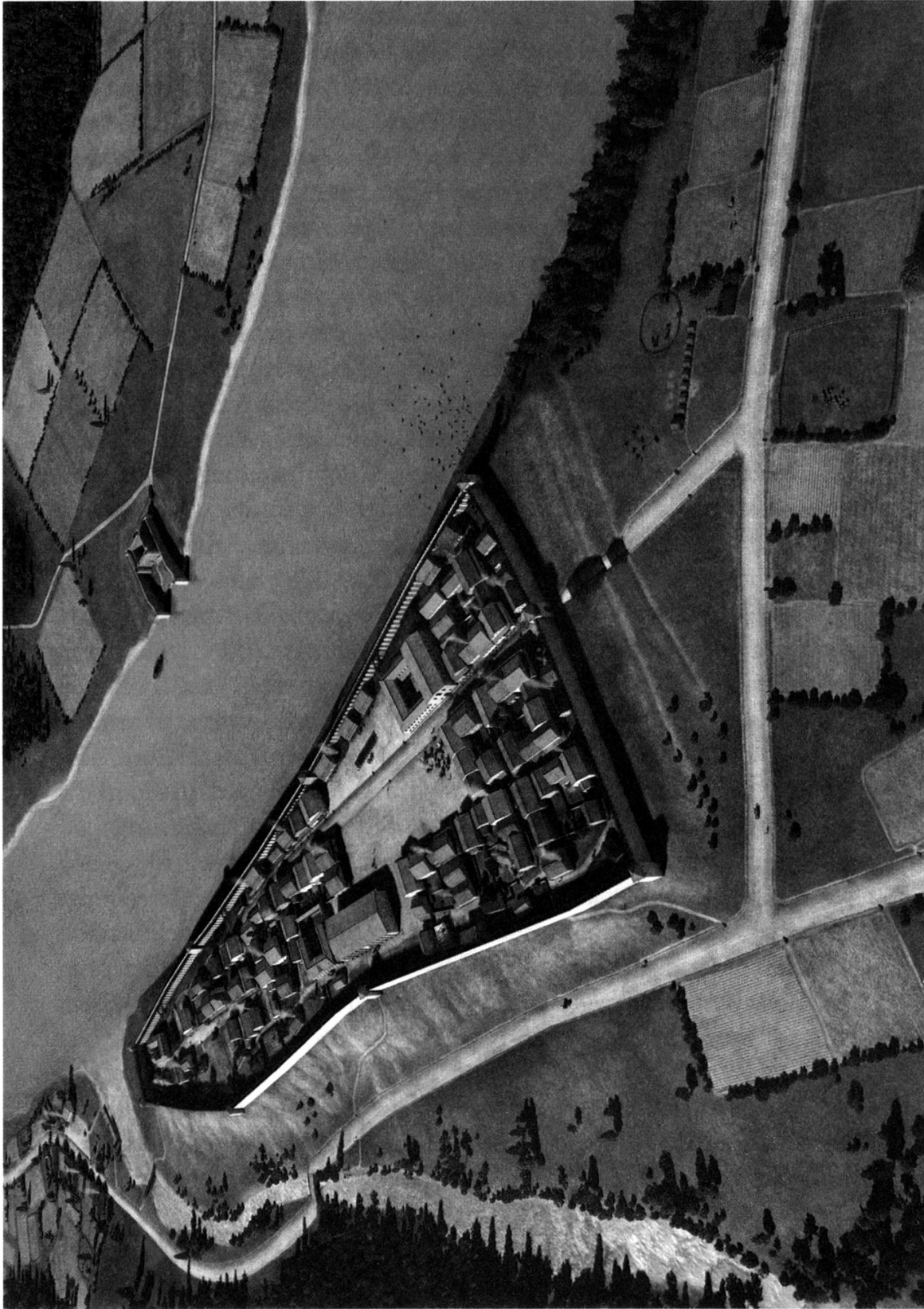
Abbildung 2 Basel um 374.