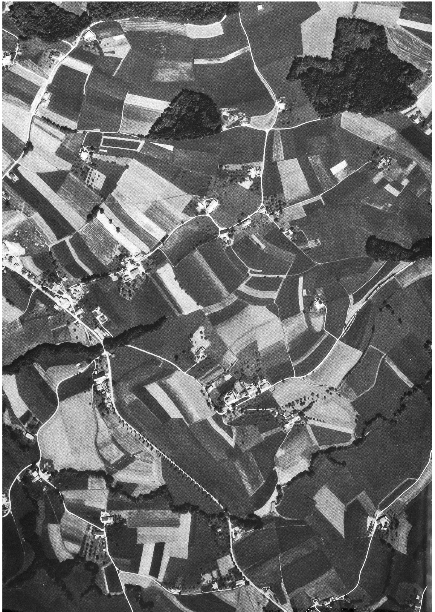
Das Senseland ist stark durch Streusiedlungen geprägt. Luftaufnahme der Gegend südwestlich von Alterswil mit den Weilern Geriwil, Obergeriwil, Zum Stein, Heimberg, Zbindenmüli, Iffertswil, Kütt.