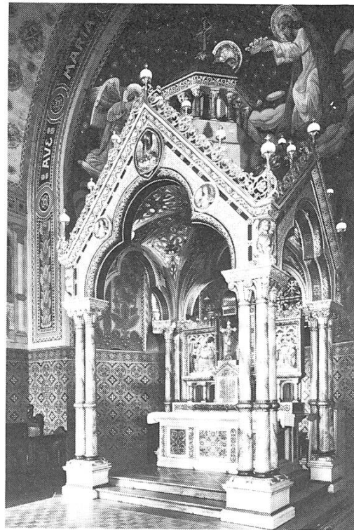
Plaffeien, Pfarrkirche. Langhaus gegen W. – Altarbaldachin von Theophil Klem