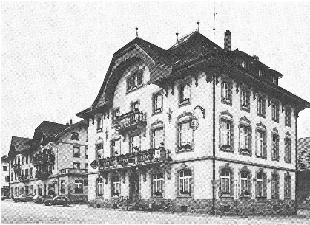
Plaffeien. Häuserzeile mit «Hirschen», erbaut nach dem Dorfbrand von 1906

basilikales Langhaus mit 5 wechselweise runden und quadratischen Arkadenpfeilern, Eingangshalle zwischen 2 oktogonalen Türmchen, von denen das nördl. als Taufkapelle dient. Das Äussere ist eine Mischung von roman. und got. Stil, die Innenarchitektur ist von einheitlich frühchristlichem Gepräge, die Ausstattung eine geglückte Mischung von frühchristlichen, roman., got. und Jugendstil-Elementen. Die Pläne sind das Ergebnis einer