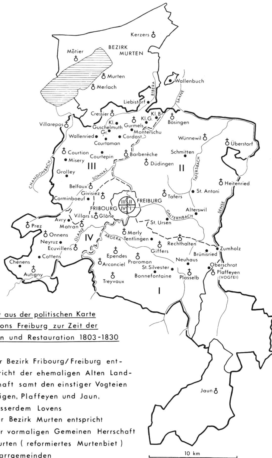
Ausschnitt aus der politischen Karte des Kantons Freiburg zur Zeit der Mediation und Restauration 1803-1830