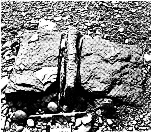
Fig. 87 Granges-Paccot. Bois de Grandfey. Blocs de molasse

Des structures d'époque indéterminée ont été repérées sur un replat situé en bordure gauche du lac de Schiffenen, à quelques mètres en aval du viaduc de Grandfey. Un petit monticule de gravier, long de 7 m, large de 5 m et haut de 50 cm, a été érigé à cet endroit. En son milieu, cinq blocs taillés ont été alignés sur un axe sud-est/nord-ouest. De nombreuses scories et bouts de métal ont été ramassés directement au nord-ouest et au nord de cette structure.