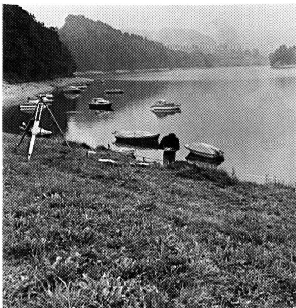
Fig. 117 Le Bry/La Chavanne . Situation du site. A l'arrière-plan, l'île d'Ogoz