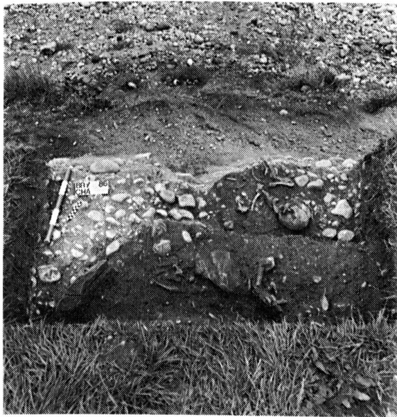
Fig. 118 Le Bry/La Chavanne . La tombe 2 avec ossuaire (premier plan) et la tombe 1