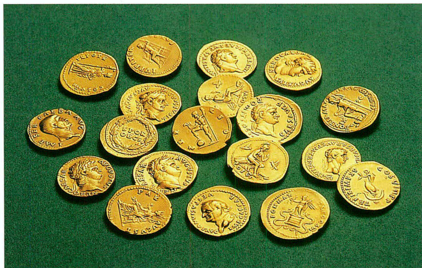
Fig. 2 Les aurei de Portalban

A proximité de l'endroit de découverte du trésor, aucun vestige autre qu'une anse en bronze représentant Mercure, mise au jour en 1927 n'a été dégagé 5 . Malgré tout, le contexte archéologique environnant est loin d'être pauvre. A Gletterens, aux lieux-dits Fin de Gros Bois et Pré de Riva par exemple, ont été exhumées tuiles et céramiques. Au Rachy, à St-Aubin, les ruines d'un établissement romain sont attestées. Enfin, n'oublions pas le site majeur de l'occupation romaine du territoire qu'est Avenches, située à environ huit kilomètres à vol d'oiseau, et les nombreuses villae implantées alentour, dont celles de Châtillon/La