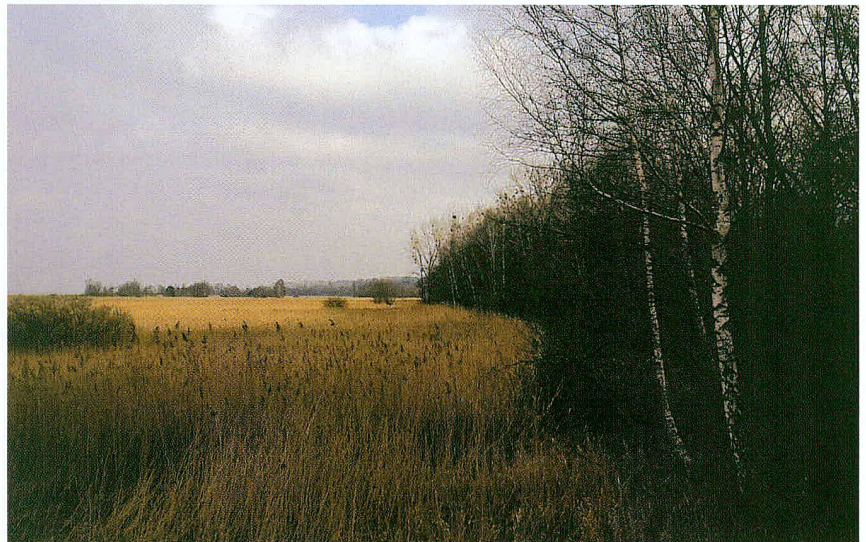
Fig. 1 Endroit présumé de la découverte

Le 24 avril 1900, à la faveur de travaux forestiers sur les grèves du lac de Neuchâtel (fig. 1), un trésor composé de dix-huit monnaies en or et de deux en bronze 1 , toutes datées du I er siècle apr. J.-C. – du règne de Tibère à celui de Titus – fut découvert à l'ouest de la commune de Portalban 2 . Enfouies à une profondeur de 15 à 20 cm, ces monnaies étaient dispersées dans le sable sur une surface d'environ un mètre carré.