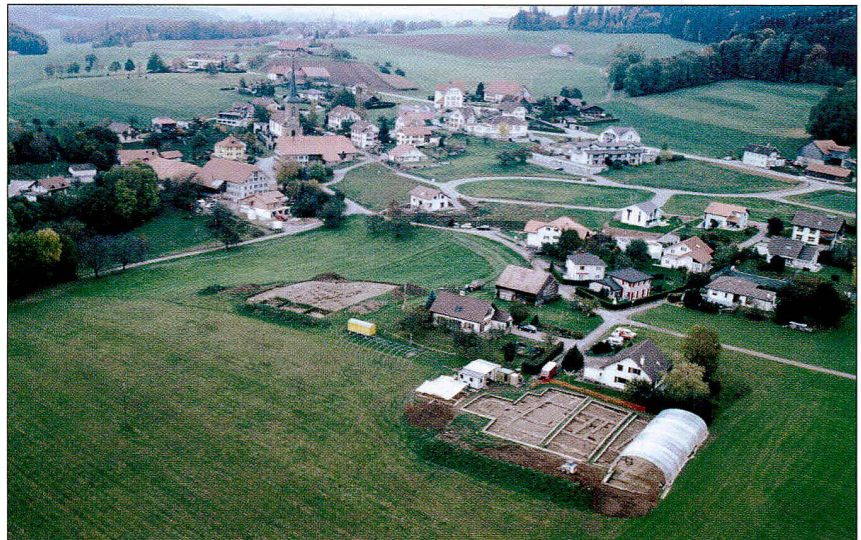
Fig. / Abb. 1 Vue aérienne du village d'Arconciel avec, au premier plan à droite, la villa gallo-romaine, à gauche la nécropole du Haut Moyen Age Luftbild von Arconciel mit der römischen villa (vorne rechts) und dem frühmittelalterlichen Gräberfeld (links)

C'est en 1991, avec la mise au jour et la fouille partielle de la nécropole gallo-romaine du Pré de l'Arche, riche d'un mobilier funéraire d'une grande opulence, que les recherches archéologiques sur le territoire de cette commune sarinoise ont véritablement commencé. En 1998, la découverte d'un abri de pied de falaise, lové dans les gorges de la Sarine et occupé durant tout ou partie du Mésolithique par les dernières populations de chasseurs-cueilleurs que nos régions aient connues, marquait le deuxième temps fort de l'histoire des recherches. S'agissant, pour l'instant, de l'un des très rares sites cantonaux bien stratifiés couvrant une fourchette de datation de plusieurs millénaires, entre le X e et le V e millénaire avant J.-C., cet abri constitue sans nul doute un écrin de choix pour la connaissance des sociétés préhistoriques régionales. Son exploration, qui a débuté en 2003 dans le cadre d'une fouille-école universitaire intercantonale, promet d'ores et déjà d'apporter son contingent de précieuses informations à la compréhension de l'histoire du peuplement du canton; elle permettra également de compléter les données préliminaires livrées en 2000 et 2002 dans deux articles, le premier traitant de la Sarine comme pôle de peuplement au Mésolithique, paru dans le deuxième de nos Cahiers d'Archéologie Fribourgeoise, le second tournant autour du canton de Fribourg entre Paléolithique final et fin du Mésolithique, publié dans le numéro 85 de l'Annuaire de la