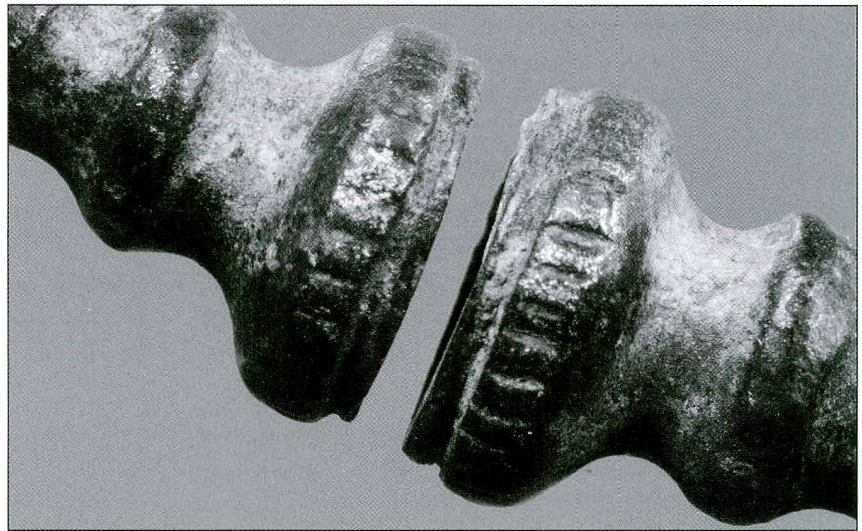
Fig. / Abb. 4 Détail des tampons de l'un des anneaux Detailaufnahme vom Stempelende eines der Ringe

La paire d'anneaux de Farvagny ornait donc vraisemblablement les chevilles d'une femme inhumée à La Tène ancienne. Sous réserve de nouvelles découvertes, ce sont les comparaisons typologiques qui nous incitent à les attribuer plus précisément à LT B2.