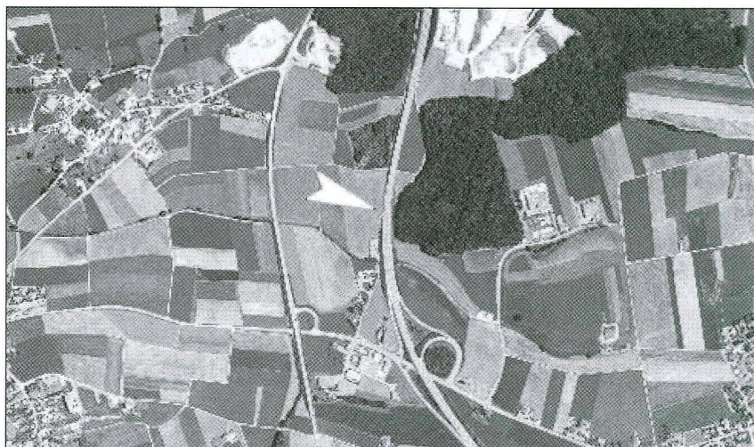
Fig. / Abb. 1 Vue aérienne de la région avec l'emplacement de l'ancienne gravière Luftbild der Region um Farvagny. Pfeil: alte Kiesgrube

A l'instar de tous les objets archéologiques privés de leur contexte de découverte, ces deux objets sont devenus de facto des pièces en suspension dans le champ de la pensée archéologique. Reconstruire leur cheminement passe, en effet, par l'utilisation de beaucoup de filtres que l'archéologue doit reconnaître et maîtriser. En fait, chacune des questions qu'il se pose les concernant doit pointer vers une même fin: tenter de reconstituer à partir d'eux-mêmes une partie du passé dont ils émanent et qui s'est évanoui. Il est clair que cette histoire, élaborée à partir de maigres éléments, demeurera toujours par bien des aspects fragile, cela d'autant que des événements qui paraissent dépourvus de tous liens entre eux et des circonstances dont la concomitance semble un simple hasard viennent bien souvent «s'imbriquer» et ainsi, brouiller les pistes. En ce sens, il est donc évident que toute tentative de recomposition de leur histoire ne pourra en aucun cas totalement dépasser le domaine des connaissances imparfaites et mal fondées.