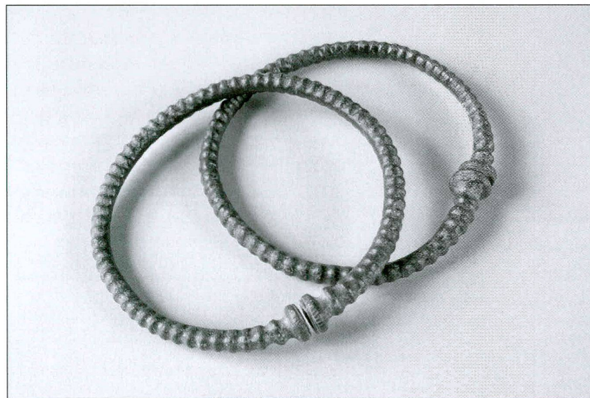
Fig. / Abb. 2

Les anneaux qui allient côtes et tampons, légèrement plus tardifs, sont présents dans des sépultures attribuées à LT B, par exemple à Aumont/Petit-Chaney FR (tombe 4), Lausanne/Vidy VD, Crissier VD et Bière/Champagne VD 4 ,