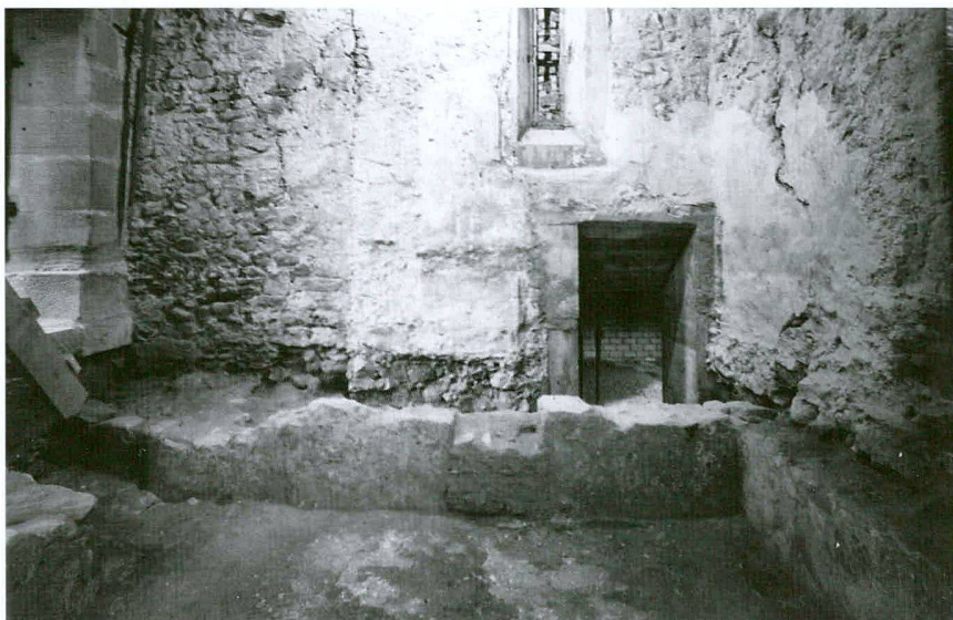
Fig. 5 Tafers/Kirche St. Martin. Barrière du chœur de la tour, vue vers l'ouest

nées illustrent l'engagement d'O. Perler dans le monde scientifique archéologique. Ainsi, le site de Heimberg, hameau de la commune d'Alterswil FR, bénéficia de son attention (fig. 3); O. Perler nous en a légué des documents inédits comprenant, outre des lettres des instances officielles concernées, un relevé topographique des structures romaines du site qui apporte des précisions bienvenues, aucun plan n'étant répertorié jusqu'à présent. Deux relevés du site de Murten/Combette FR, accompagnés de notes de la Commission archéologique, se trouvaient dans le même dossier. Ces documents datent de 1903 pour Murten/Combette et de 1904 pour Alterswil/Heimberg.