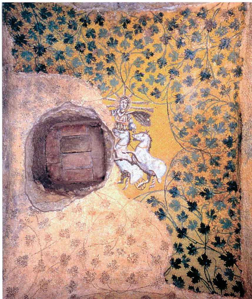
Fig. 2 Rome. Mosaïque du Christ-Hélios sur la voûte du mausolée des Lulii (tiré de S. Romano – M. Andaloro, La pittura medievale a Roma, 312-1431 , Milano 2006, corpus 1, 127, fig. 1)

La richesse du fonds d'archives Perler est révélatrice de la carrure du personnage. La correspondance recèle un florilège de remerciements et de propos flatteurs. Anciens élèves, collègues et amis, dont certains ont eu recours à ses compétences dans le domaine scientifique ou durant leur cursus universitaire, tous n'ont eu que des éloges à son égard.