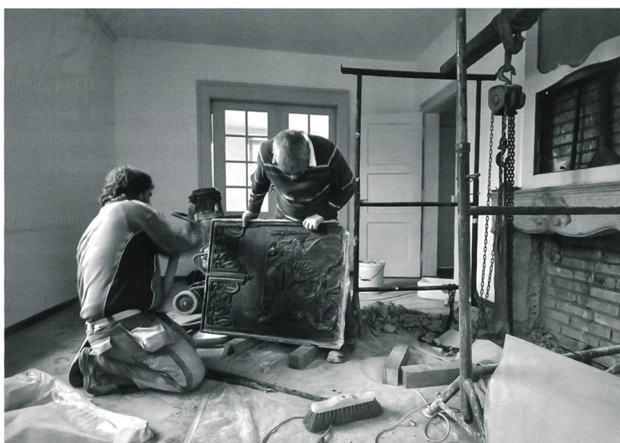
Fig. 3 Dépose de la taque de poêle: une opération délicate!

La découverte de la taque de la Planche-Inférieure 4 était en soi une sensation, mais il fallait absolument pouvoir la déposer et la présenter au public, ce qui risquait d'être compromis par le passage en mains privées du bâtiment qui l'abritait. Une action rapide s'imposait, et le Service archéologique entreprit tout de suite des démarches auprès des personnes concernées, soit M. Stéphane Maret, Directeur des Services industriels de la