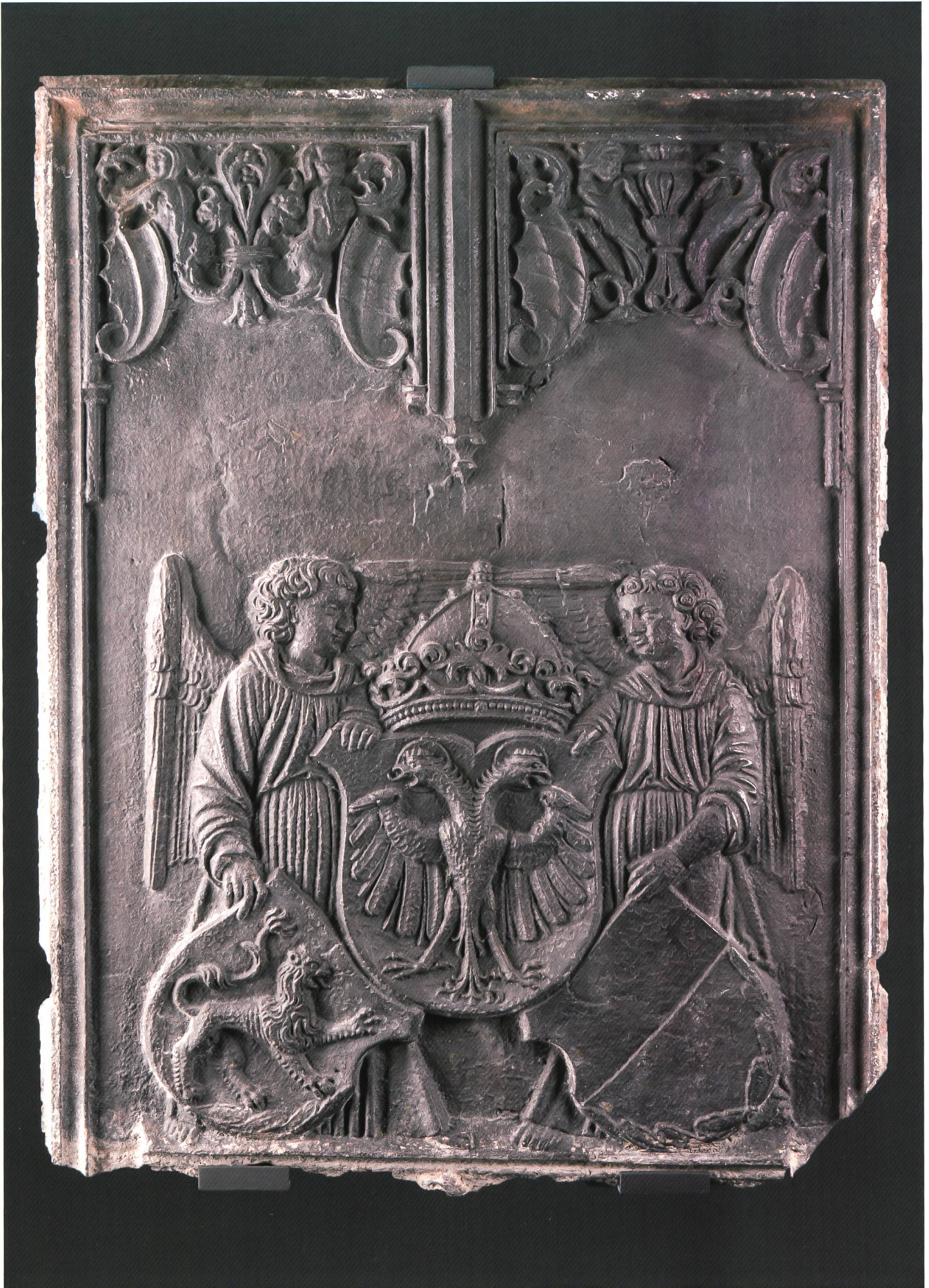
Fig. 2 Taque aux armes de l'Empire, des Zaehringen et de Fribourg pour le poêle de la salle du Grand Conseil, aujourd'hui au Musée d'art et d'histoire de Fribourg; modèle de Hans Gieng fondu par Hans Löler de Kandern (D), 1540