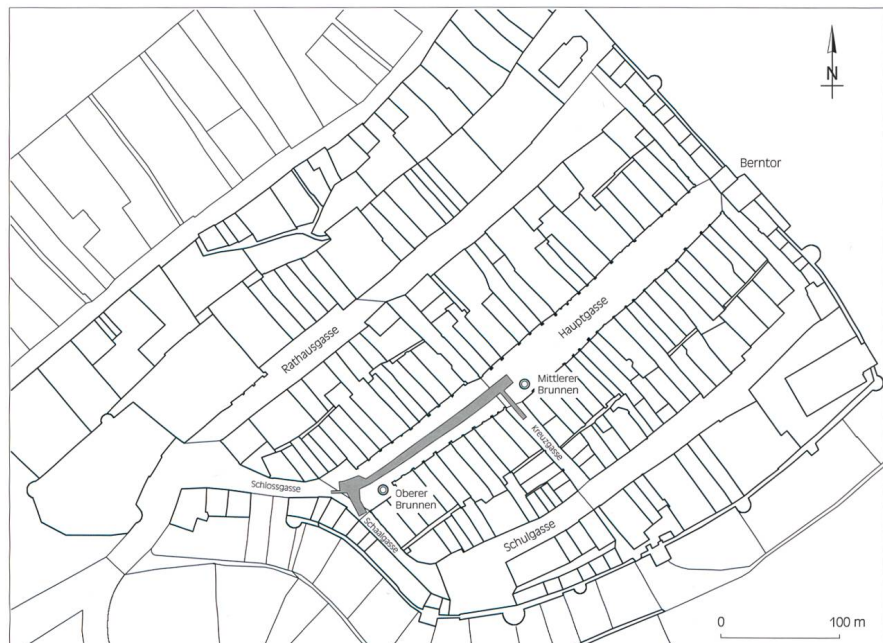
Abb. 1 Plan der Stadt Murten mit Eintragung des untersuchten Abschnitts der Hauptgasse

Die ältesten erhaltenen Niveaus der Hauptgasse konnten mittels Radiokarbonanalyse, in Verbindung mit der relativchronologischen Einordnung gemäss ihrer