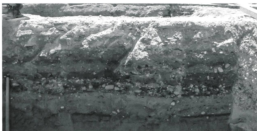
Abb. 3 Die mit Brandschutt durchsetzte Schicht im Bereich vor der Hauptgasse Nr. 2 (breites, dunkles und steiniges Band in der Profilmitte); die Pflasterung von 1820-1825 lag höher als die auf dem Bild ersichtliche Terrainoberkante

sichtbaren Gassenhorizont, bestehend aus einer harten kiesigen Oberfläche, wurden bis zu 50 cm aufplaniert. Diese Aufschüttungen mit kiesigem Material erfolgten wohl in mehreren Etappen, wobei sich deren Schlusspunkt durch einen Keramikfund ungefähr ins 15. Jahrhundert datieren lässt. Damit einher ergab sich eine Ausplanierung, die zu einem einheitlicheren Gassengefälle von durchschnittlich 1,8% führte. Die mittlere Phase gilt als Sammelphase und umfasst mehrere Jahrzehnte.