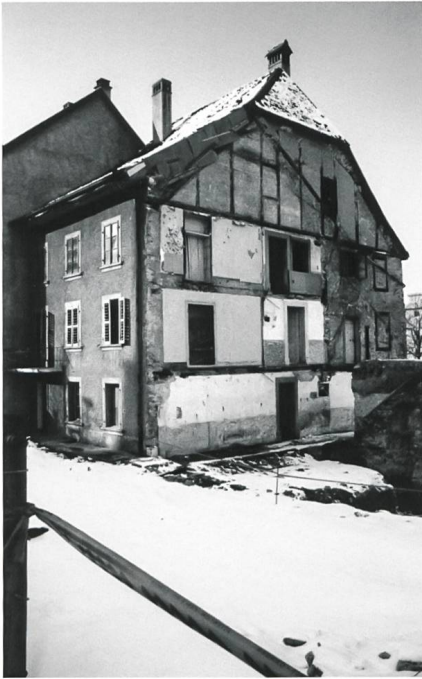
Fig. 8 Maison de la seconde moitié du XVII e siècle, avant sa démolition en 1992

en revanche plusieurs cas comparables: l'Unterstadt de Berthoud (seconde moitié du XIII e -XIV e siècle) 19 , la Brunngasse à Berne (XIII e -XIV e siècles) 20 , Thun/Bälliz 30 (XIV e siècle) 21 ou Wiedlisbach 22 . A Berthoud et Berne, les constructions légères en front de rue abritaient des échoppes ou des ouvriers, mais à Bulle, elles possédaient un foyer (domestique? artisanal?). A Hermance, Berthoud, Berne, Thone et Wiedlisbach, ce mode d'implantation ne concerne que les maisons adossées à l'enceinte, non celles en cœur d'îlot.