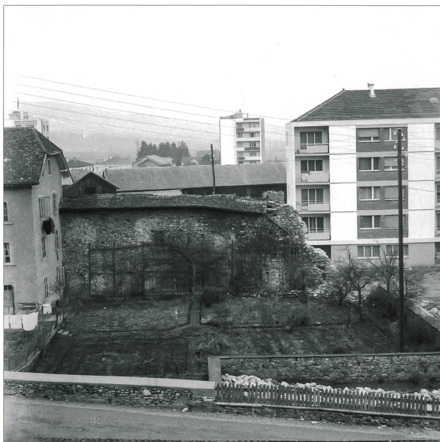
Fig. 1 Ancien emplacement de la scierie Binz transformé en jardin avec, à l'arrière, le mur d'enceinte encore conservé sur toute sa hauteur (env. 8 ou 9 m); vue depuis la rue de la Poterne, en 1962

Les recherches archéologiques ont repris en 2013, se concentrant particulièrement au sud de l'enceinte, intra muros , partie de la vieille ville qui s'est profondément déstructurée à partir de 1943 avec l'incendie de la scierie Binz qui en occupait l'angle nord-est. La façade orientale et un mur de refend de ce bâtiment étaient en fait constitués par la muraille elle-même. Or la scierie n'a pas été remise en activité après le sinistre, ses ruines ont été arasées et le terrain a été transformé en jardin (fig. 1). Durant les années 1960, la muraille a été tronquée d'un segment au nord et écrêtée de la moitié de sa hauteur