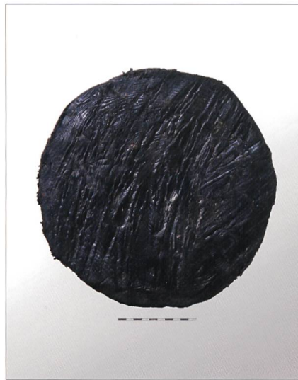
Fig. 3 Base d'un pieu en sapin portant des traces de hache ou d'herminette (1277/1278)

La forme et les contours de l'établissement pré-urbain sont toujours à découvrir. A cette époque, les constructions ne s'étendaient pas encore sur la parcelle explorée à la rue de la Poterne. Cette zone en contrebas de l'église était alors en grande partie marécageuse, à l'exception de sa partie la plus élevée, au sud-ouest. La nappe phréatique, restée très haute, se trouvait à 1-1,2 m de profondeur; elle était probablement alimentée par un ruisseau et par le ruissellement dans l'ancien fossé ainsi que, comme cela semble être toujours le cas aujourd'hui, par l'ancien canal des Usiniers qui subsiste encore sous l'église 11 . La fouille des niveaux les plus profonds a en effet permis de mettre au jour une importante couche de limon riche en matières organiques conservées grâce à la présence de l'eau, reposant directement sur le terrain naturel fluvio-glaciaire et présentant un pendage en direction du nord-est. Totalement inondée, cette zone n'était guère propice à la construction d'habitations, ce qui explique qu'elle est restée hors du noyau pré-urbain. La création et l'expansion de la ville de Bulle ont certainement donné l'impulsion nécessaire à l'assainissement de ce secteur, rendant ainsi possible son urbanisation. Les travaux d'assèchement se sont étalés entre 1242 et 1277/1278,