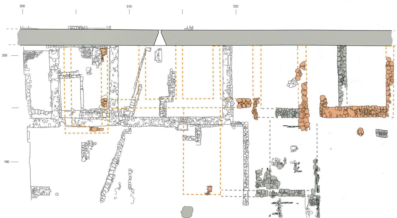
Fig. 7 Relevé de l'enceinte et des constructions contemporaines (entre 1300 et 1318; en vert)

légères. Ce type d'implantation a été adopté à Hermance GE à partir de 1247 17 ou, dans notre canton, à Estavayer-le-Lac dans le quartier de la Bâtiaz dont la charte de 1338 fixe très précisément l'implantation des constructions 18 ; dans ces deux cas toutefois, aucune construction légère n'avait été érigée sur la partie antérieure des parcelles. Le canton de Berne offre