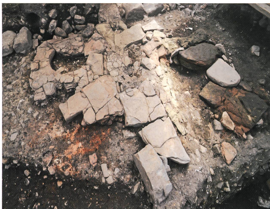
Fig. 6 Le double foyer en molasse

Dans notre région, seules les recherches menées à Wangen an der Aare BE 15 et au Landeron NE 16 ont livré des données qui ont permis de préciser ou de confirmer les dates de construction de ces deux petites villes, entre 1252 et 1257 pour la première et en 1328/1329 pour la seconde. Dans les deux cas, des bois conservés dans le sous-sol ont permis de dater la mise en chantier, mais comme à Bulle, ils ne donnent pas d'indication