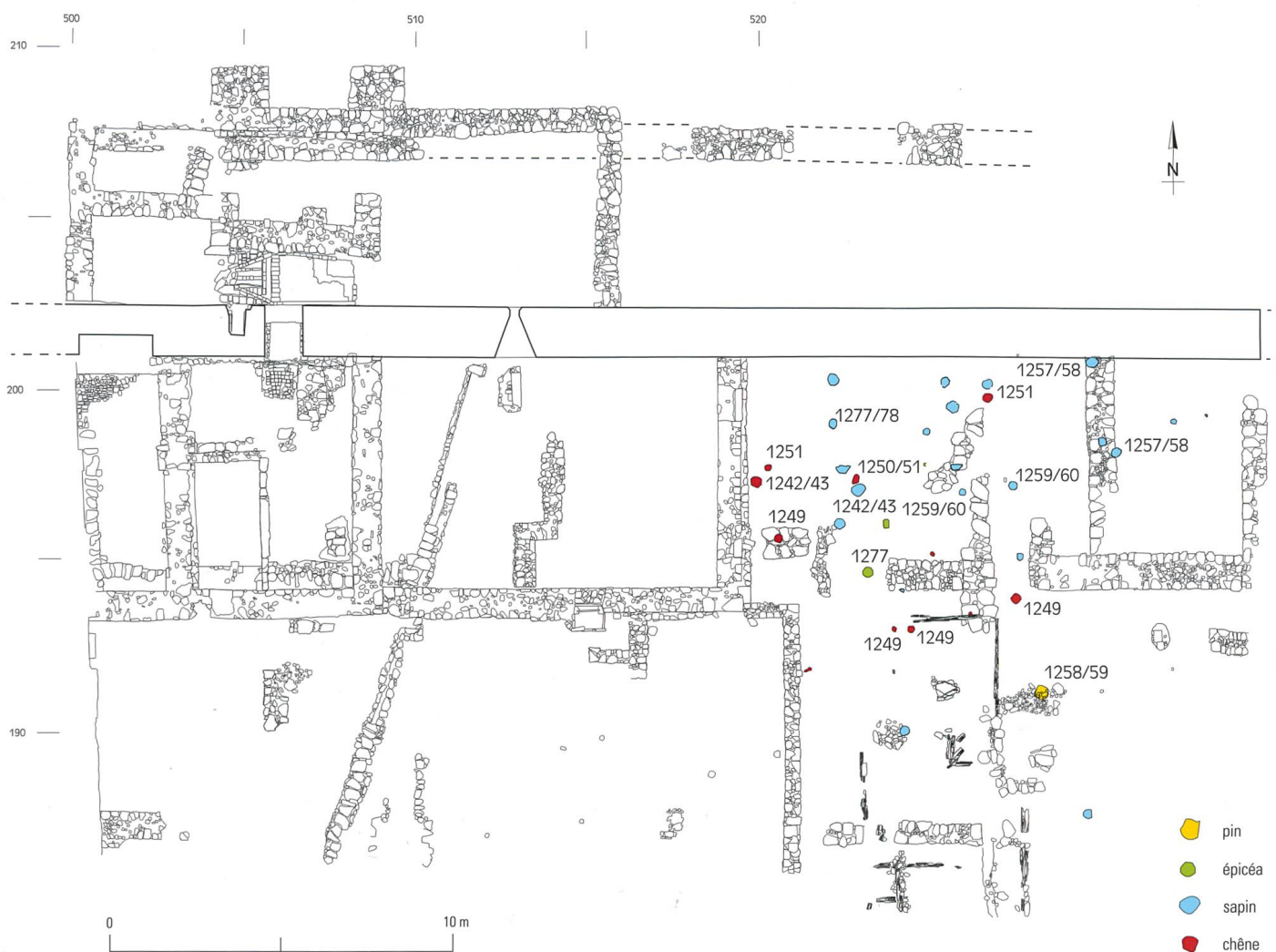
Fig. 2 Répartition et datation des pieux mis au jour dans l'ancienne zone marécageuse, reportés sur le plan d'ensemble des vestiges

L'agglomération de Bulle est demeurée concentrée autour de l'église jusqu'au XIII e siècle, avec le statut de centre régional non seulement sur le plan ecclésiastique, mais aussi au niveau économique, ce qu'atteste la confirmation, en