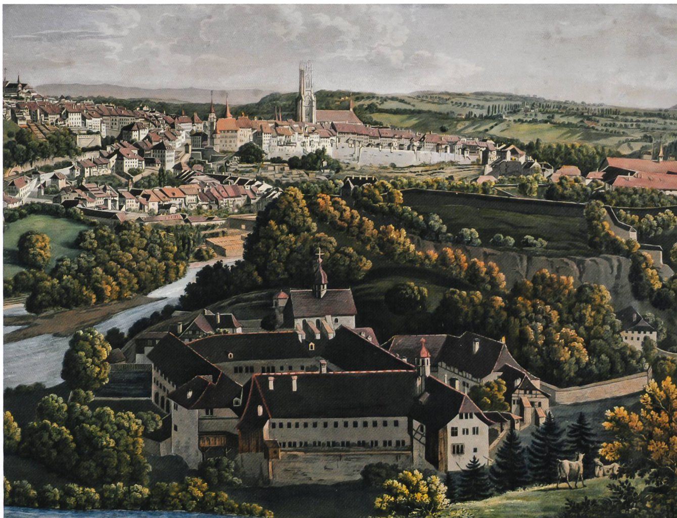
Fig. 2 Vue sur l'abbaye de la Maigrange, au premier plan, et la ville de Fribourg vers 1830, extrait d'une lithographie de Joseph Kappeler

fois transformée, reste à établir par des datations dendrochronologiques 6 , mais il est probable que des édicules-latrines, voire des galeries, y ont été ancrés dès les années 1660.