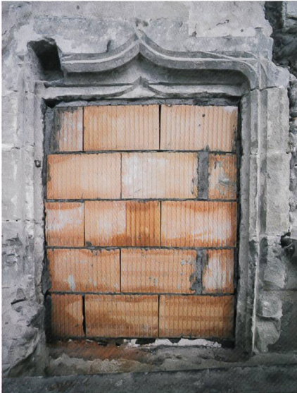
Fig. 3 Encadrement de la porte des anciennes latrines (aile sud) après son dégagement