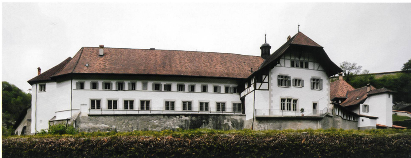
Fig. 1 Fribourg/Abbaye de la Maigrauge: vue générale des façades sud après restauration

Le suivi de restauration effectué sur les façades sud des bâtiments conventuels de l'abbaye de la Maigrauge (aumônerie, ailes orientale et méridionale, sans le sous-bassement) 1 complète les investigations menées par les archéologues au gré des travaux, qui ont débuté en 1982 par le réfectoire et l'église 2 et se sont poursuivies en 1996/1997 dans le grenier et l'aumônerie 3 , puis en 2002 dans l'aile occidentale qui abritait le logis abbatial 4 . Les recherches de 2013 se sont limitées aux parties décrépies et au suivi du chantier, car la conservation des enduits interdisait une analyse exhaustive (fig. 1) 5 .