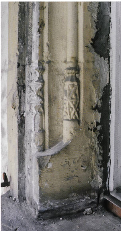
Fig. 4 Détail des congés à douilles de la fenêtre du logis de la Mère Abbessse (aile orientale)

Les analyses réalisées en 2013 ont permis de préciser l'étendue des travaux de reconstruction suite à l'incendie de 1660. Il reste toutefois encore à définir leur ampleur dans l'aile orientale, qui a conservé une partie de ses maçonneries médiévales. Les datations dendrochron-