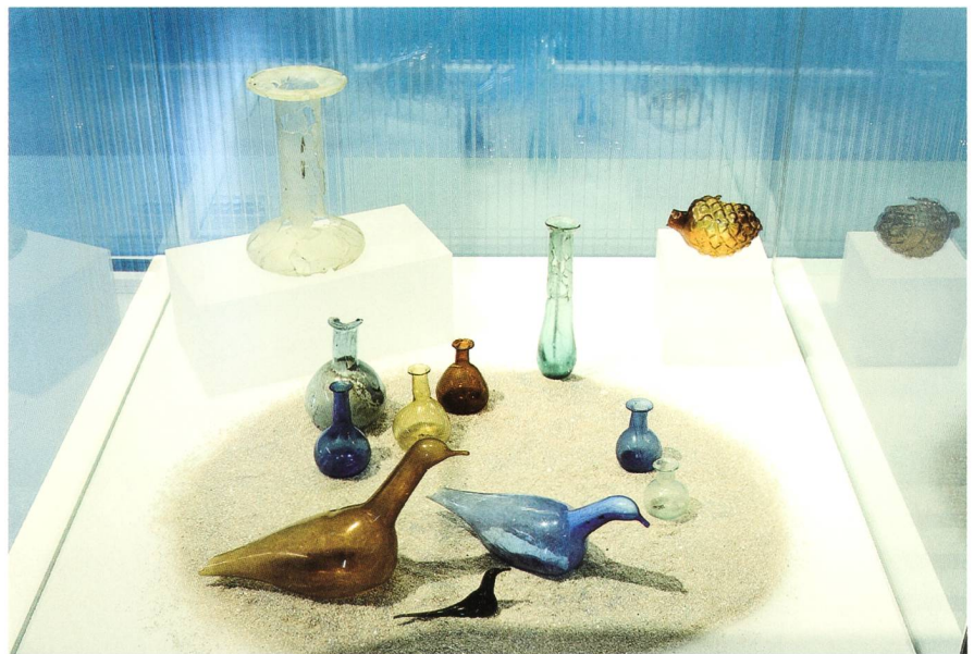
Fig. 1 Vases à parfum

Nous connaissons également les nombreux objets en lien avec les soins du corps, que les fouilles archéologiques livrent souvent: miroirs, peignes, épingles à cheveux, rasoirs, pincés à épiler, tablettes à fards, flacons à onguents et vases à parfums... Et encore: les cure-oreilles et les sondes auriculaires, les sondes-spatules et les sondes-cuillères aux noms savants de «spathomèles» et de «cyathis-comèles», autant d'instruments que se