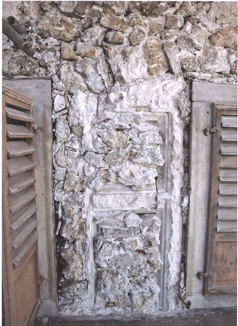
Fig. 9 Vestiges de l'une des fenêtres à croisée du deuxième étage

Le premier étage a conservé quatre exemples supplémentaires de fenêtres, côtés nord et est, dont deux à simple chanfrein. L'une d'elles, plus haute que les autres, témoigne peut-être de la présence de la cage d'escalier menant au deuxième étage. La troisième, pourvue d'un encadrement rectangulaire à simple retrait, apporte de l'éclairage au-dessus de l'entrée.