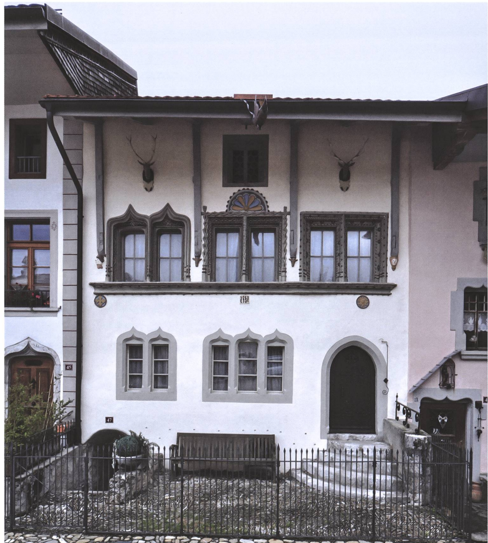
Fig. 14 Exemple de façade décorée au plâtre sur la maison du fou Chalamala

À l'instar de ce qui a pu être observé dans le Chablais vaudois et en Valais, les rares occurrences de notre canton, à Fribourg et à Rue, se limitent à des aménagements intérieurs. L'emploi du plâtre cuit à haute température tant dans la construction (hourdis de colombage) que dans l'ornementation des façades donne un caractère unique aux exemples gruériens, dont l'un des plus beaux restaurés, si ce n'est le plus beau se trouve dans le bourg d'En-Bas, sur la maison du fou de Pierre IV de Gruyères, dite de Chalamala (fig. 14).