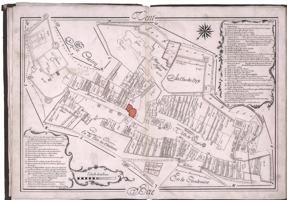
Fig. 5 Plan géométrique de la ville de Gruyères daté de 1741-1745, avec surlignage du bâtiment analysé (en rouge)

L'édifice se dresse alors sur au moins deux niveaux (pl. 1, jaune). Des moellons de calcaire gris et de rares fragments de tuf ont été utilisés dans l'élévation des murs, qui mesurent jusqu'à environ 2 m d'épaisseur 13 . Les modules, variables, sont joints au mortier, de couleur brun-beige, chargé de gravillons noirs.