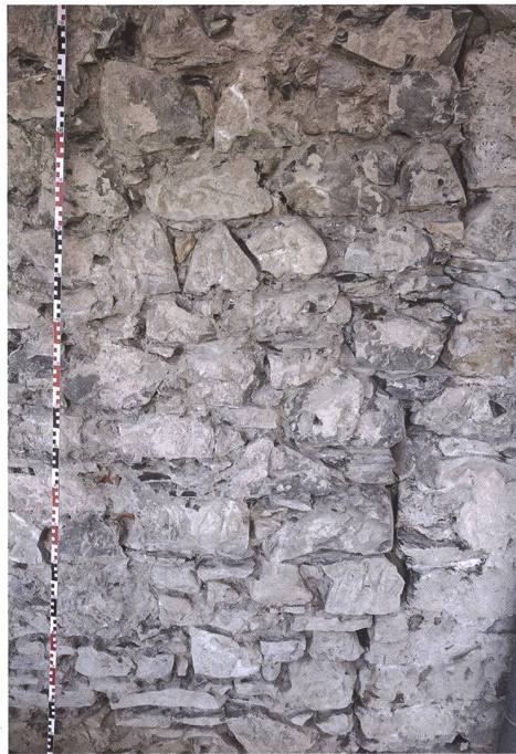
Fig. 6 Extrémité nord-est de la maison primitive, visible grâce à la différence des modules en façade