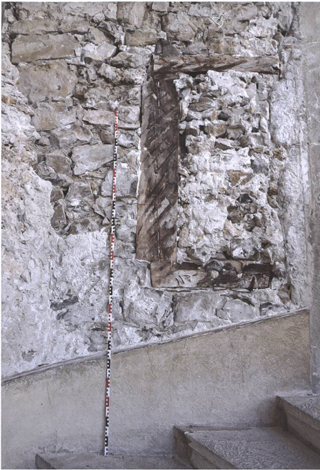
Fig. 8 Fenêtre remontant à la première phase de transformation du bâtiment

plusieurs tronçons révèlent la confection d'une charpente avec des épicéas et des sapins abattus au plus tôt en 1597. Cette étape de construction a donc été entreprise près de 100 ans après les premiers aménagements observés. Au nord, le premier étage a été prolongé au-dessus du chemin d'accès au château sous la forme d'une galerie (voir fig. 3). L'élévation consiste en un hourdis de plâtre rosé comprenant des moellons de tuf.