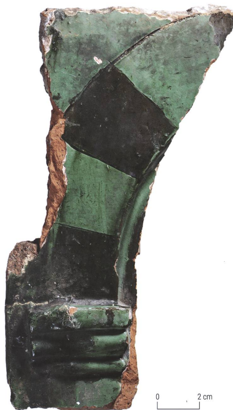
Fig. 11 Fragment de catelle de poêle retrouvé dans des déblais provenant de la rue du Château 2 (GRU-RCH2 2000/1)

Le nombre et la distribution des pièces demeurent toujours inconnus pour cette étape, mais la découverte d'un fragment de catelle de poêle dans les déblais des transformations intérieures en 2000 donne un aperçu du type et de la qualité des infrastructures de l'intérieur du bâtiment au cours du XVI e siècle 25 . Cette catelle de corps plate à glaçure verte présente une bichromie obtenue par l'alternance de zones pourvues ou non d'engobe (fig. 11). Sa pâte est fine, plutôt dure, de couleur rouge orangé, et contient de minuscules inclusions minérales blanches ainsi que des grains de chamotte. On y distingue