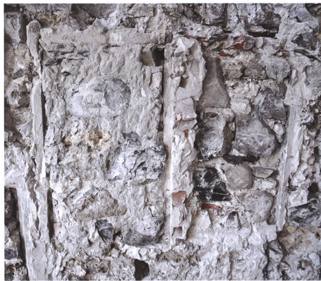
Fig. 10 Fenêtres successives à encadrement rectangulaire simple

Le nombre et la distribution des pièces demeurent toujours inconnus pour cette étape, mais la découverte d'un fragment de catelle de poêle dans les déblais des transformations intérieures en 2000 donne un aperçu du type et de la qualité des infrastructures de l'intérieur du bâtiment au cours du XVI e siècle 25 . Cette catelle de corps plate à glaçure verte présente une bichromie obtenue par l'alternance de zones pourvues ou non d'engobe (fig. 11). Sa pâte est fine, plutôt dure, de couleur rouge orangé, et contient de minuscules inclusions minérales blanches ainsi que des grains de chamotte. On y distingue