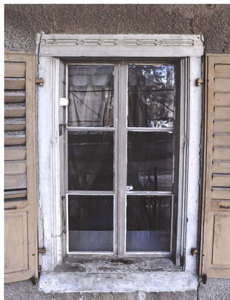
Fig. 13 Fenêtre à encadrement de bois sculpté