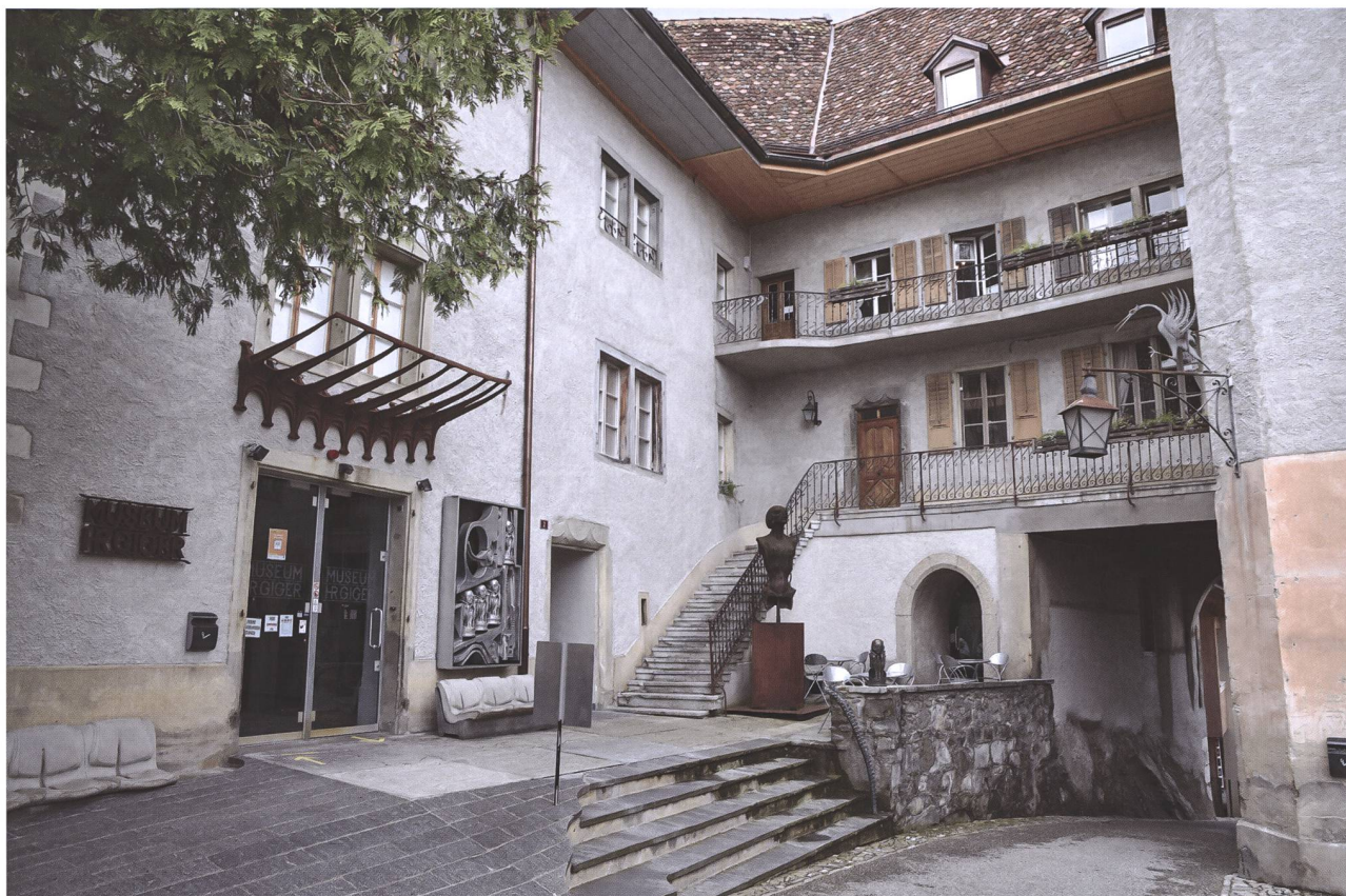
Fig. 1 L'édifice abritant le musée HR Giger et la porte Saint-Germain vus depuis le bourg d'En-Haut