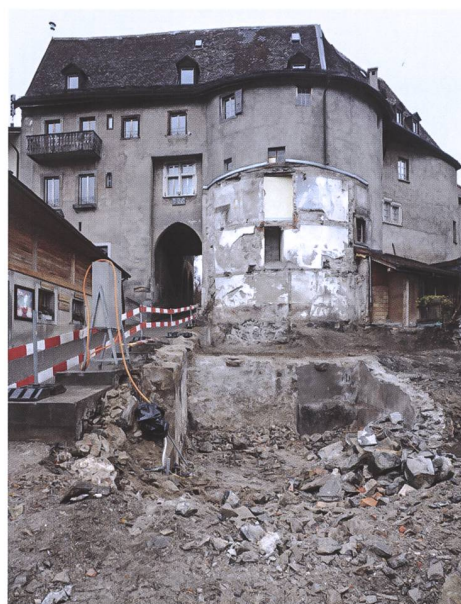
Fig. 2 La porte Saint-Germain vue depuis le bourg d'En-Bas

Depuis le bourg d'En-Bas, ses façades paraissent infranchissables. Cette démonstration de force est due à la déclivité du terrain, qui dresse la bâtisse en véritable nid d'aigle précédant la demeure seigneuriale (fig. 2). Cet effet était autrefois aussi renforcé par le chemin d'accès étroit qu'il fallait emprunter en franchissant un fossé 3 puis