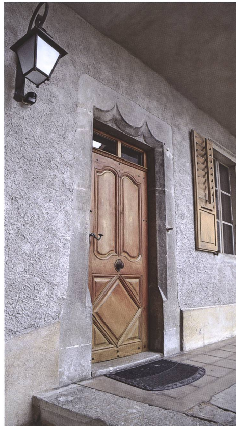
Fig. 12 Porte du premier étage dotée d'un arc à double inflexion

porte aux réflexions archéologiques et historiques sur l'importance défensive et politique du bourg d'En-Haut, encore trop mal connue. Un travail rigoureux à l'intérieur et à l'extérieur des bâtiments lors des futurs travaux permettra sans doute de récolter davantage de données sur la fonction et la densité d'occupation de ce lieu à mi-chemin entre la ville et le centre du pouvoir.