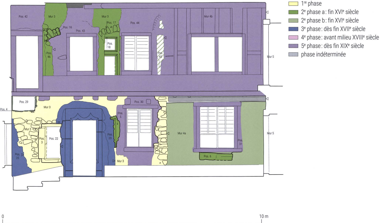
Planche 1 Élévations du bâtiment de la rue du Château 2 à Gruyères; a) façade nord; b) façade est