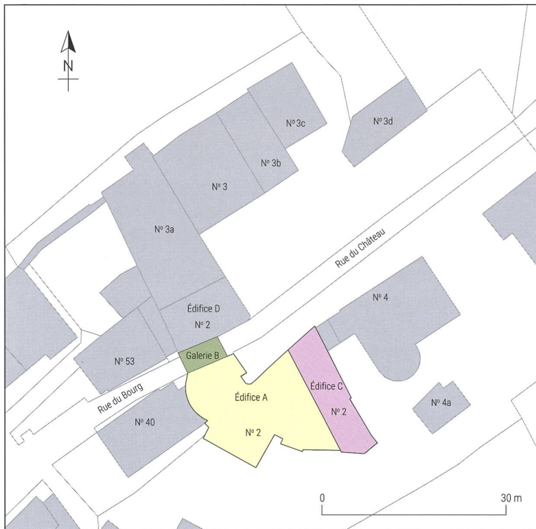
Fig. 3 Plan du bâtiment d'origine (A), de son annexe (B), de son extension à l'est (C) et de son bâtiment mitoyen (D)

4 On constate cependant sur la façade nord que le crépi extérieur se prolongeait derrière le bouchon d'une fenêtre de la façade orientale. L'encadrement vraisemblablement asymétrique de cette fenêtre pourrait aussi aller dans le sens d'une fusion préalable de deux bâtiments pour n'en former qu'un seul.