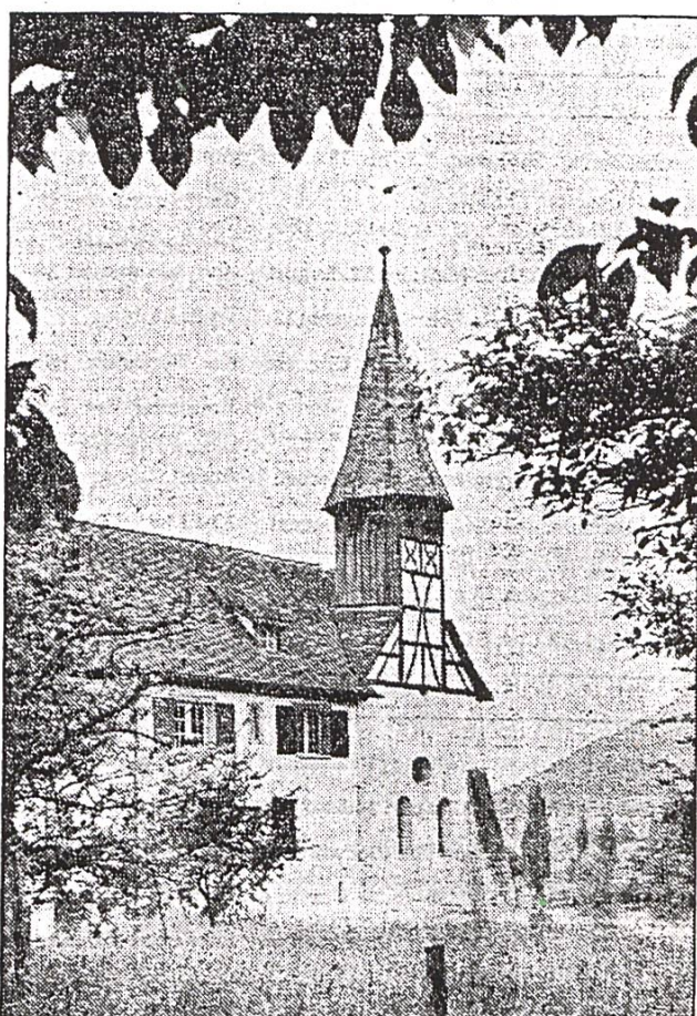
Die Probstei ist noch älter als die berühmte Glocke im Riegelturn. Das Klösterchen wurde 1083 gestiftet.