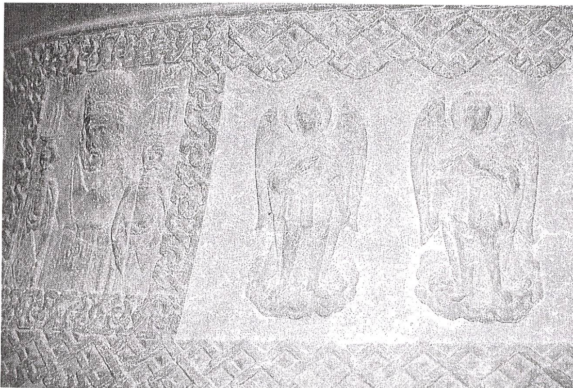
Cloche / Glocke 4