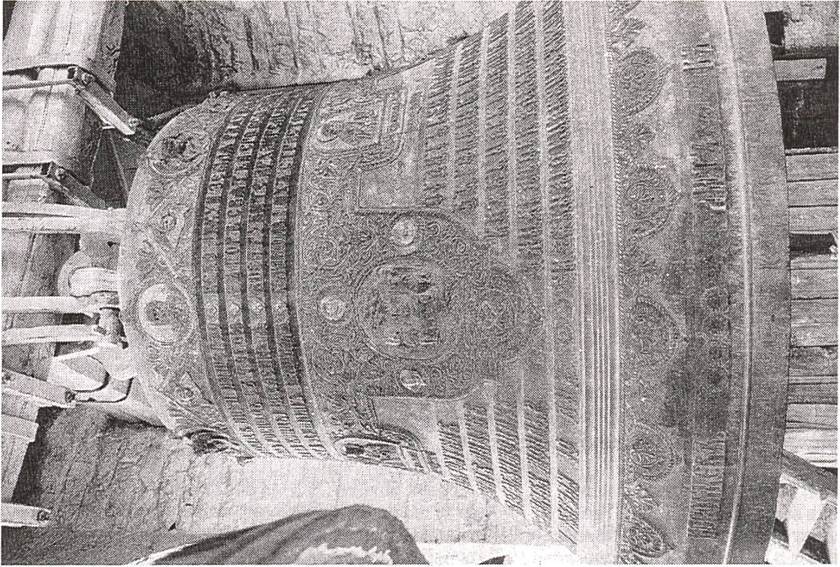
Cloche / Glocke 1