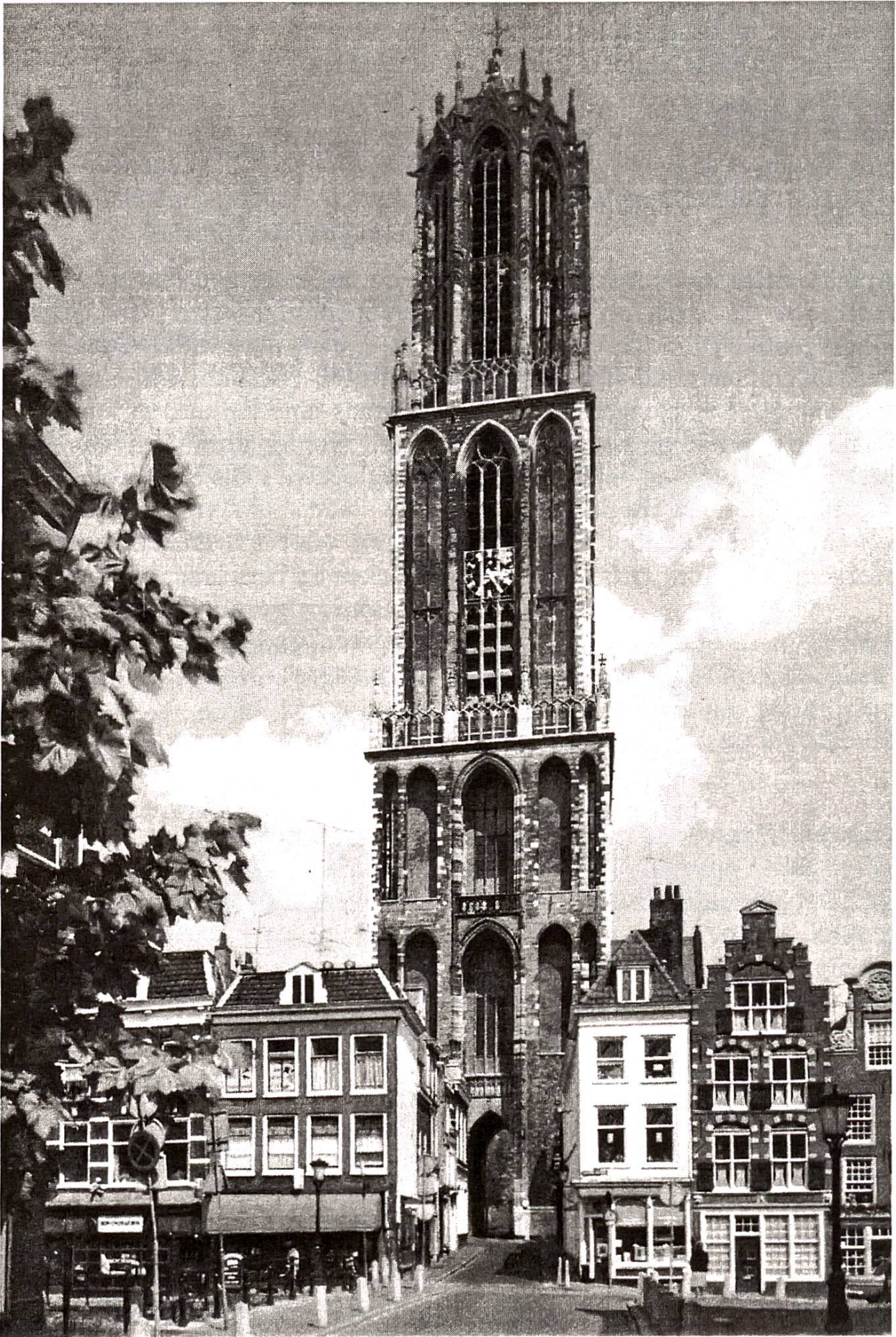
Le clocher du dôme d'Utrecht (112m.) Der Utrechter Domturm