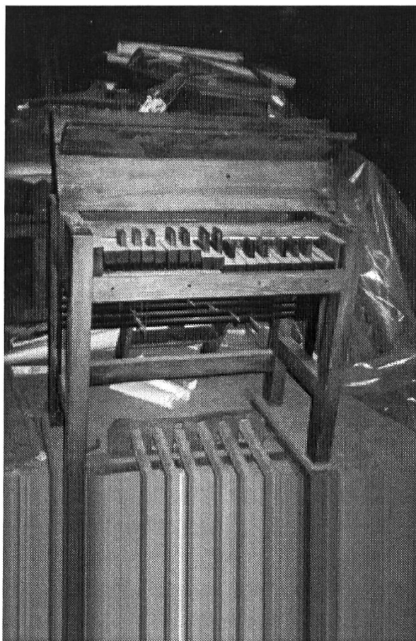
Abb. 2 : Die Paccard-„Pianoklaviatur“ von 1928 des Carillons im Rathaus von Cambrai (Frankreich), in Gebrauch bis 1975 (Photo Alfred Drapier, März 1999).

Die Blütezeit der „Pianoklaviaturen“ war nur von kurzer Dauer. Bereits in den dreissiger Jahren begann man, sie wieder durch die bewährten Stockklaviaturen zu ersetzen (Sint-Truiden 1929, Rouen 1933, Enkhuizen 1936, Maastricht 1938). Die meisten übrigen wurden wahrscheinlich in den