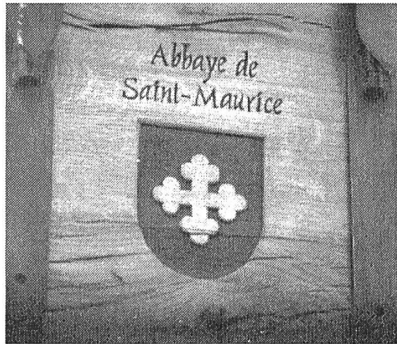
Détail du joug sculpté

L'ascension de la cloche fut impressionnante. Le camion-grue, stationné devant la basilique, à 21 mètres de la base de la tour, devait hisser le bourdon à 25 mètres de hauteur, et l'introduire dans la tour par une baie géminée dont on avait enlevé la colonne centrale ; l'espace ainsi libéré permettait un passage