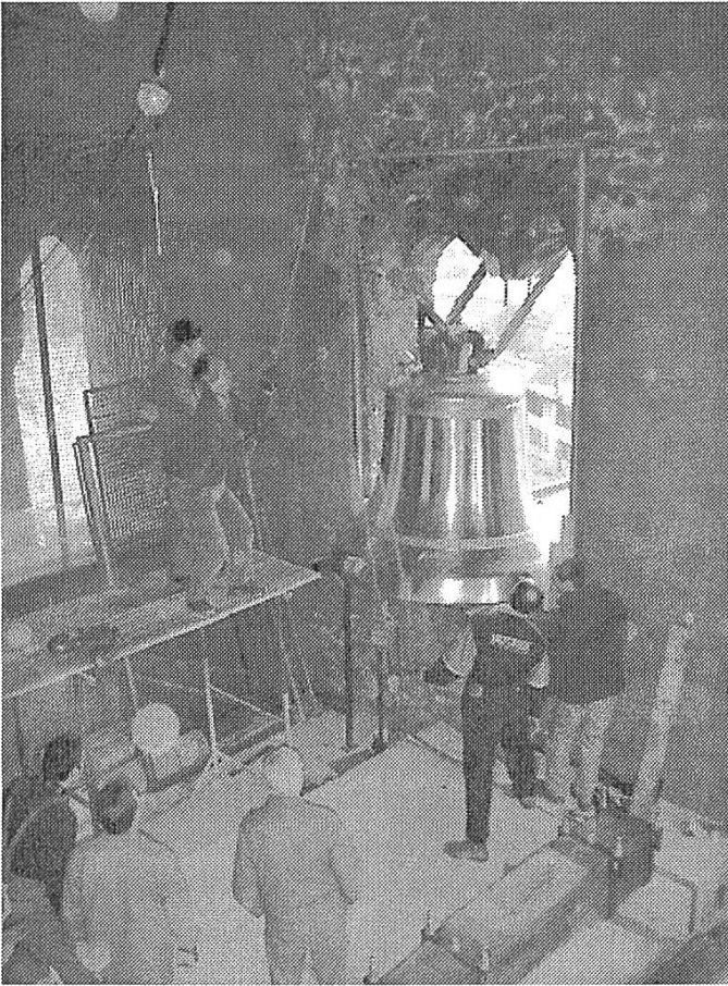
L'entrée de la cloche dans la tour du XI e siècle Einführung der Glocke in den Turm aus dem 13. Jhdt.

d'extrême justesse. De nombreux badauds bravèrent le froid vif de cet après-midi de novembre pour vivre en direct un événement abondamment couvert par les médias.