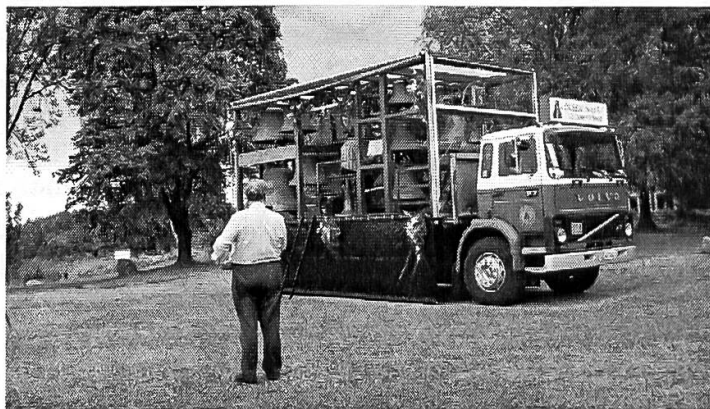
Fahrbares Glockenspiel Olsen Nauen

Un ensemble finnois de handbells , dont nous avons déjà pu entendre les sons éthérés lors du culte d'ouverture à la cathédrale, animait de sa musique la réception du maire d'Oslo, à l'hôtel de ville, en présence de son altesse Sonja, reine de Norvège.