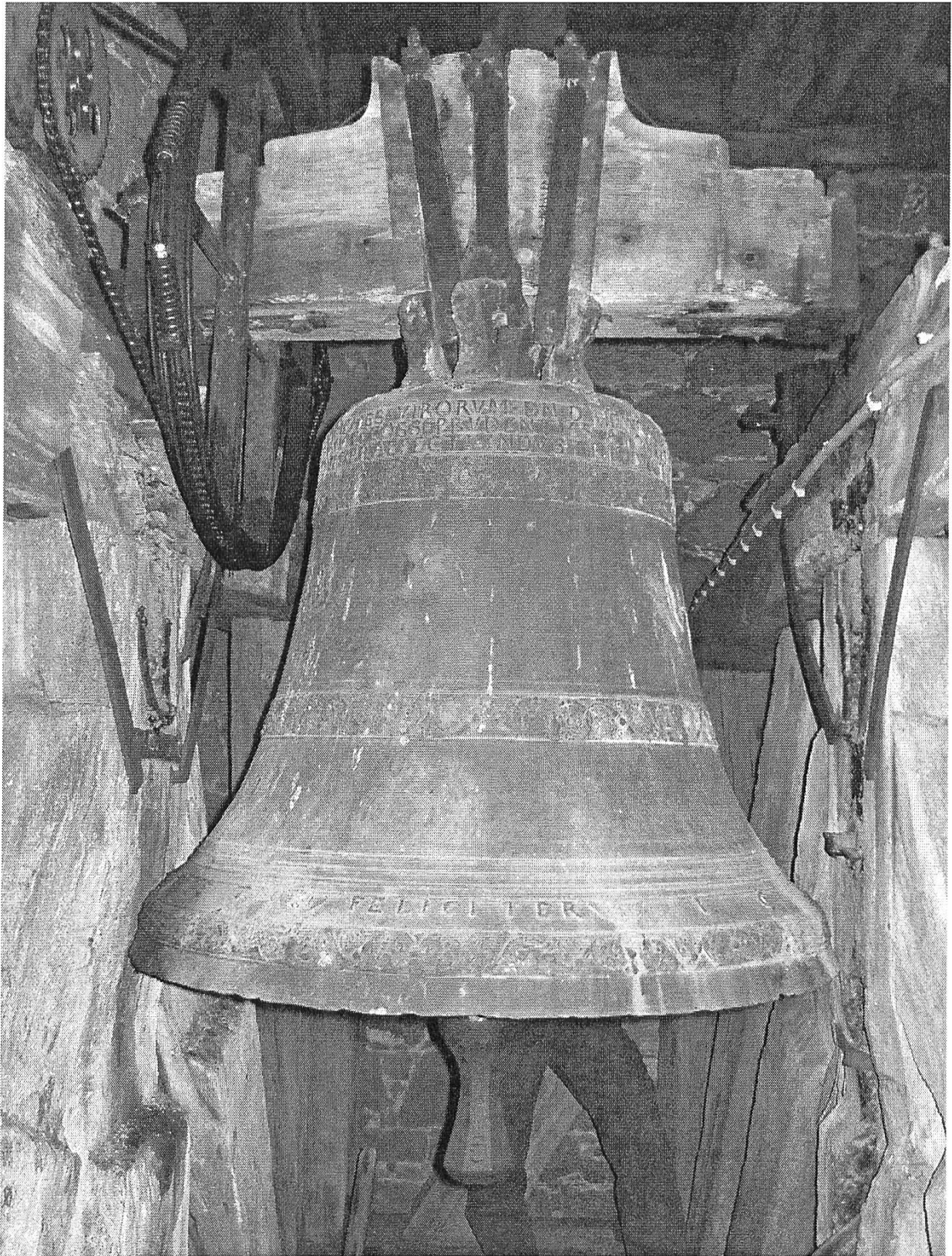
Bergkirche Hallau: Glocke von Benedict Flach, Schaffhausen, 1623