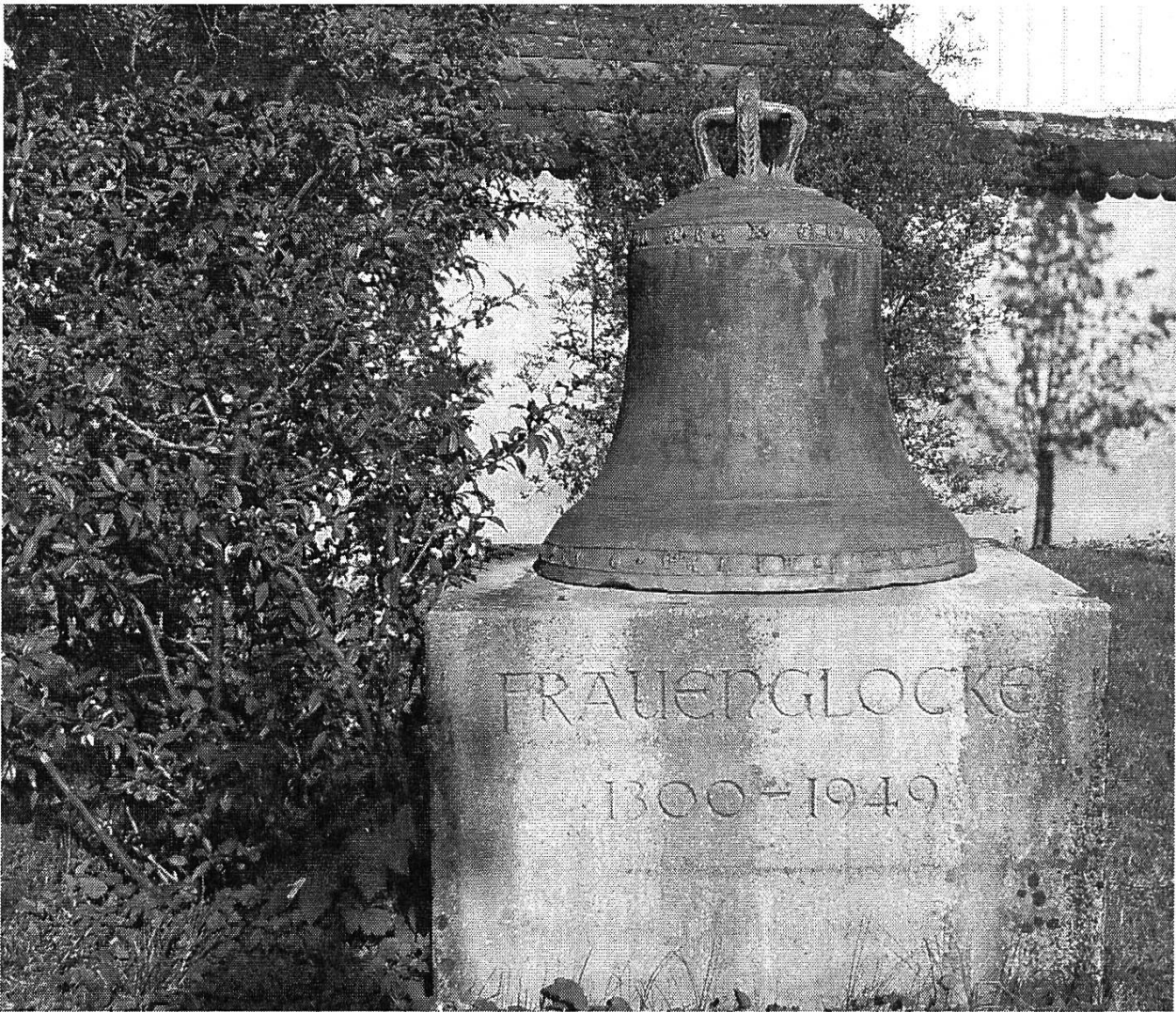
Ref. Kirche Siblingen: Abgestellte Frauenglocke von ca. 1300 im Kirchgarten

körpern (cis", e", gis") kann die ev. ref. Kirche Osterfingen aufwarten: zwei alte Glocken (eine vermutlich von 1479, die andere von 1579) sowie eine neue (die grösste) der Fa. Rüetschi, Aarau, gegossen 1973.