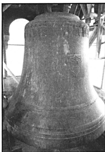
Abb. 3: Bürglen, Pfarrkirche. Grosse Glocke h° mit kräftigem Fries aus Ähren und Trauben, die das Abendmahl symbolisieren. Foto Matthias Walter, 2006.

Binnenstruktur der Schlagtonfolge; insbesondere wegen der deutlich zu hoch stehenden Glocke 5. Ebenso wenig kann mit Sicherheit behauptet werden, dass dies den anderen in Frage kommenden damaligen Giessereien besser gelungen wäre.