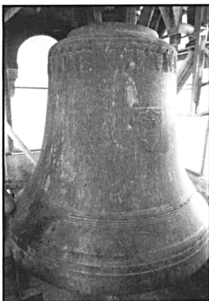
Abb. 3: Bürglen, Pfarrkirche. Grosse Glocke h° mit kräftigem Fries aus Ähren und Trauben, die das Abendmahl symbolisieren. Foto Matthias Walter, 2006.

Binnenstruktur der Schlagtonfolge; insbesondere wegen der deutlich zu hoch stehenden Glocke 5. Ebenso wenig kann mit Sicherheit behauptet werden, dass dies den anderen in Frage kommenden damaligen Giessereien besser gelungen wäre.