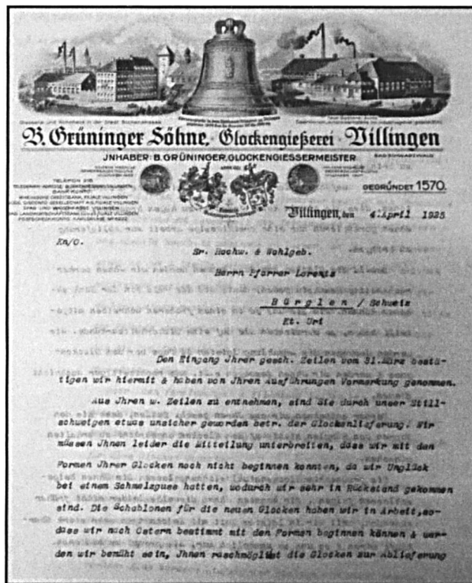
Abb. 2: Briefkopf und Schreiben der Firma Grüniger Söhne vom 4. April 1925, in dem Bürglen erneut auf später vertröstet wird. Im Briefkopf in der Mitte die 1909 gegossene as°-Glocke des Münsters in Villingen, eine der grössten Glocken des Werks (zerstört).