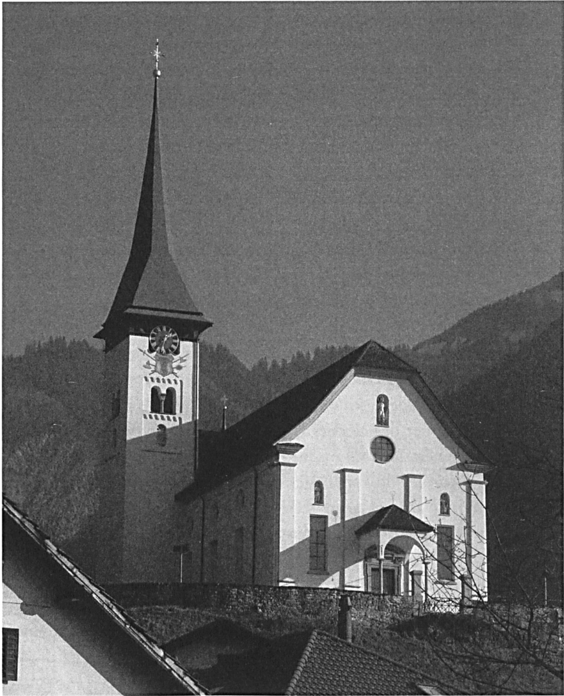
Pfarrkirche Bürglen.