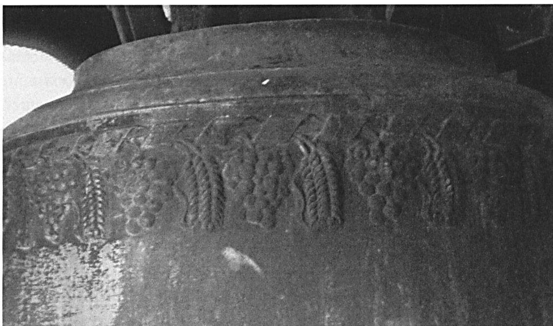
Abb. 4: Bürglen, Pfarrkirche. Grosse Glocke h°.

bestimmt nicht in der qualitativen Minderwertigkeit, die der kommerziell argumentierende Grüninger diesen bescheinigte.