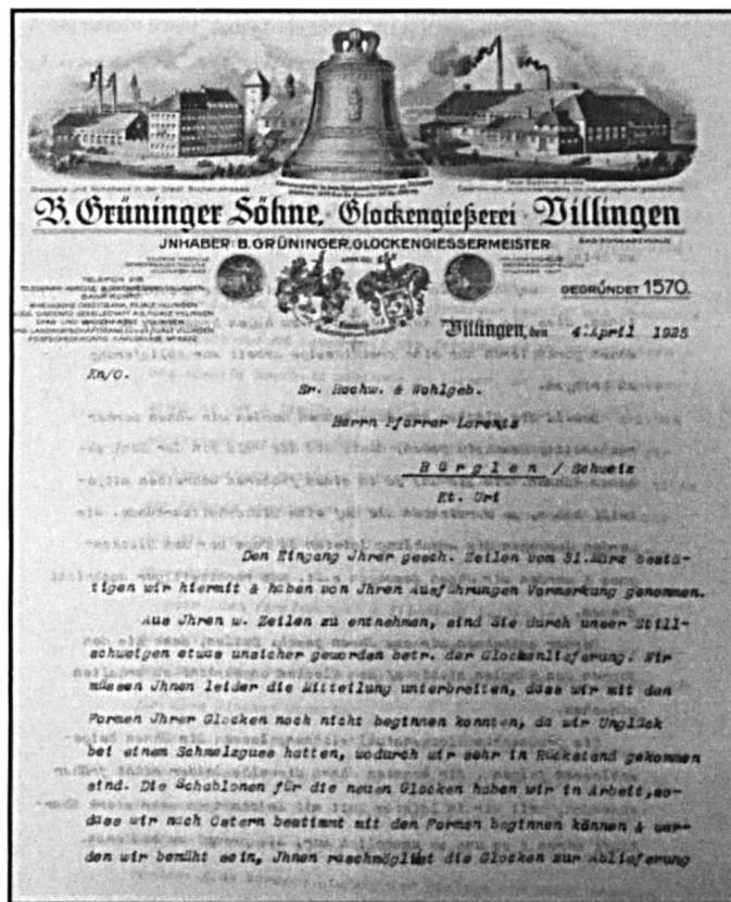
Abb. 2: Briefkopf und Schreiben der Firma Grüniger Söhne vom 4. April 1925, in dem Bürglen erneut auf später vertröstet wird. Im Briefkopf in der Mitte die 1909 gegossene as°-Glocke des Münsters in Villingen, eine der grössten Glocken des Werks (zerstört).